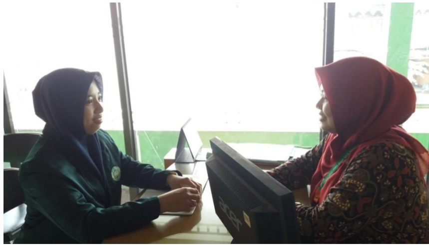
Proses wawancara dengan ibu tanti selaku teller (2)