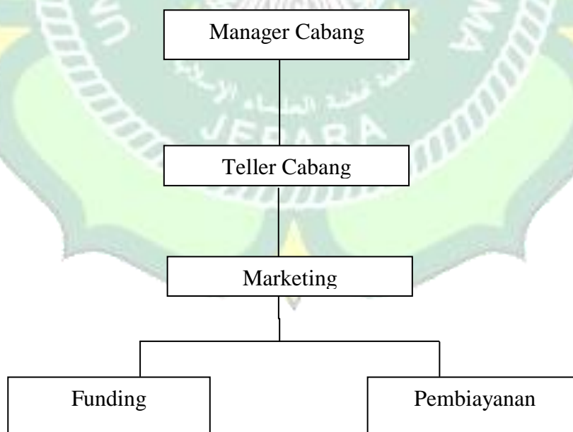
Gambar 3.2 Susunan pengurus KSPPS BMT Mitra Muamalah