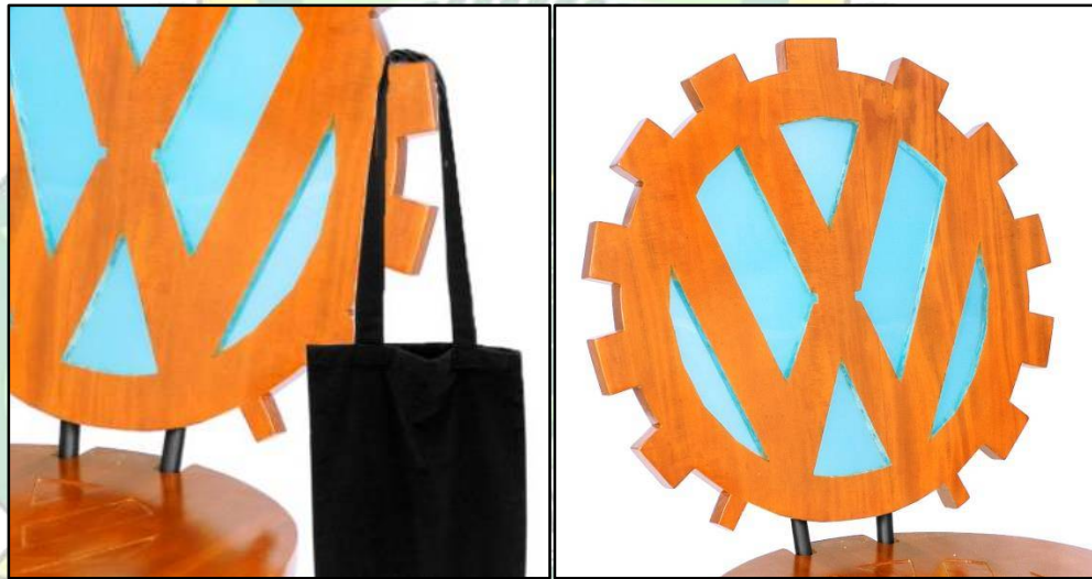
Gambar 4.2. Sandaran Punggung

Pada bagian sandaran punggung berbentuk logo VW tahun 1939-1945 berdiameter 57 cm dengan aksesoris bergerigi yang khas dan penambahan material resin pada sela-sela motif memperkuat kesan unik dari kursi ini, selain sebagai bentuk yang unik gerigi ini juga dapat difungsikan sebagai tempat untuk menggantung tas (untuk jenis-jenis tas yang ringan dan kecil).