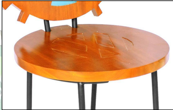
Gambar 4.3. Dudukan Kursi

Pada dudukan kursi ini berbentuk bulat diameter 50 cm memiliki motif logo VW sebagai refleksi atau pantulan dari bentuk sandaran sehingga memiliki bentuk yang selaras.