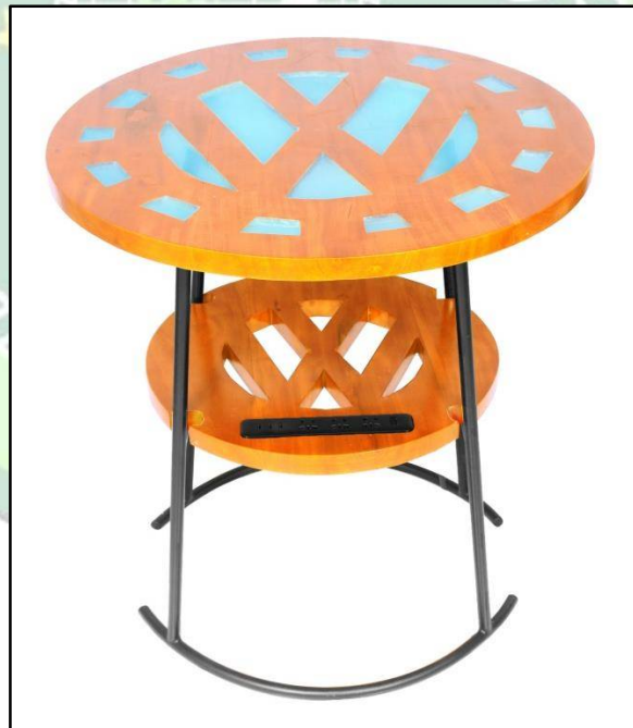
Gambar 4.5. Meja Kafe Logo Volkswagen (VW)