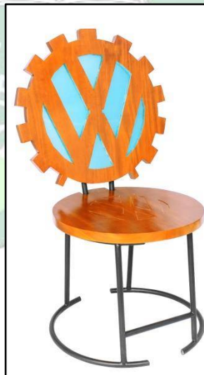
Gambar 4.1. Kursi Kafe Logo Volkswagen (VW)