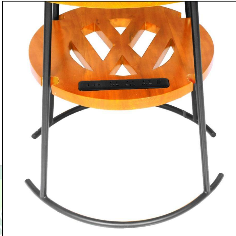
Gambar 4.7. Kaki Meja