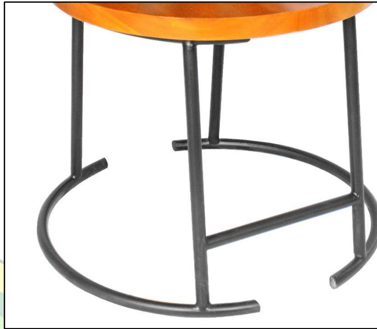
Gambar 4.4. Kaki Kursi