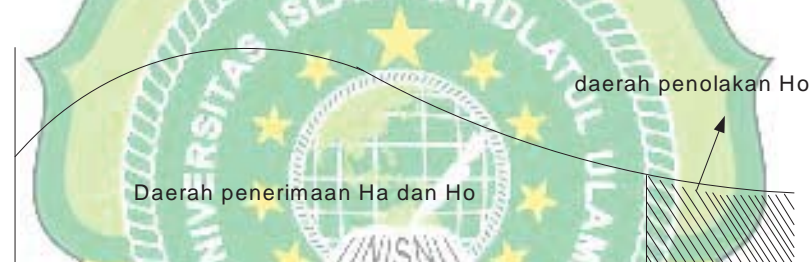
Gambar 3.1. Uji F

Pengujian setiap koefisien regresi bersama-sama dikatakan signifikan bila nilai mutlak F_h \geq F_t maka hipotesis nol ( H_0 ) ditolak dan hipotesis alternative ( H_a ) diterima, sebaliknya dikatakan tidak signifikan bila nilai F_h < F_t maka hipotesis nol ( H_0 ) diterima dan hipotesis alternatif ( H_a ) ditolak.