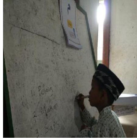
FOTO MENERJAKAN LATIHAN