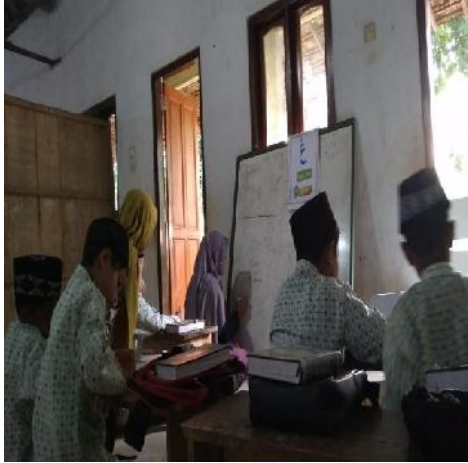
FOTO KEGIATAN PEMBELAJARAN