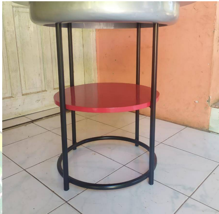
Gambar 4.8. Kaki Meja