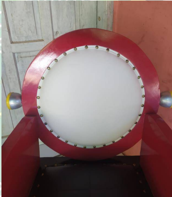
Gambar 4.2. Sandaran Punggung

Pada bagian sandaran punggung berbentuk seperti lampu motor. Dengan diameter 50 cm, dan tebal 3 cm. Dipilihnya bentuk seperti lampu motor karena terinspirasi dari lampu depan motor CB 100 tahun 1970. Pada bagian tengah berbentuk lingkaran menggunakan busa jok, karena terinspirasi dari kaca lampu pada motor CB 100.