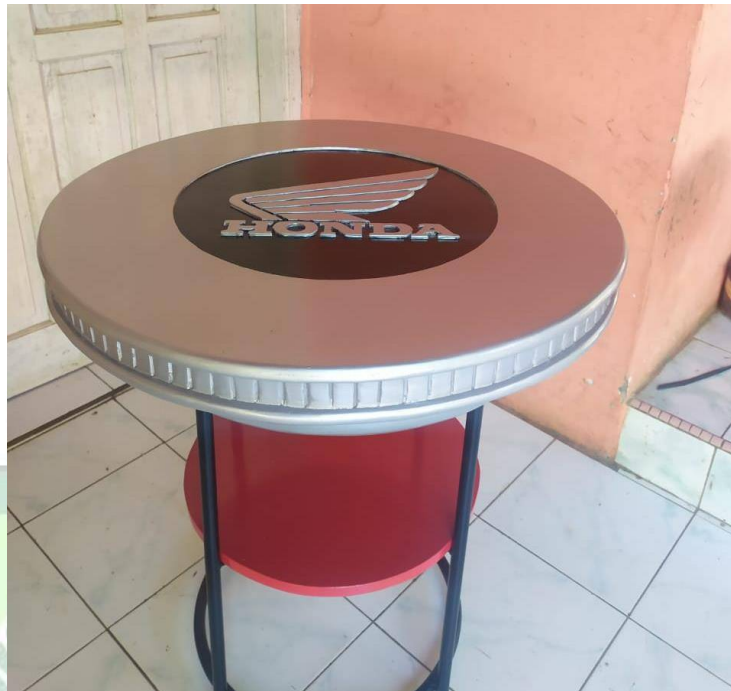
Gambar 4.7. Daun Meja