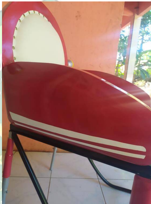
Gambar 4.3. Sandaran Tangan

Pada bagian sandaran tangan berbentuk seperti tangki pada motor CB 100 tahun 1970. Yang berukuran panjang 48 cm, tinggi 22 cm, dan tebal 5 cm. dengan warna menyerupai tangki motor CB 100 tahun 1970.