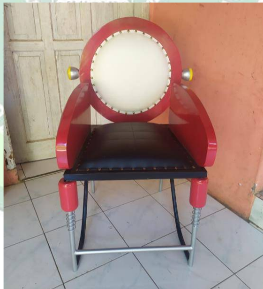
Gambar 4.1. Kursi Kafe Motor CB