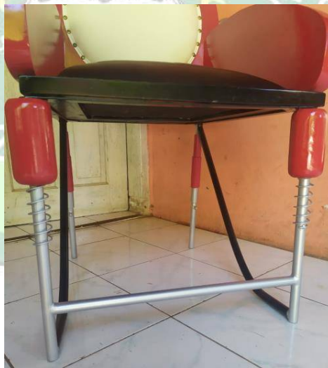
Gambar 4.5. Kaki Kursi

Kaki kursi ini berjumlah 4 seperti kaki kursi pada umumnya, kaki kursi depan berbentuk seperti sock motor CB bagian belakang, sedangkan kaki kursi belakang berbentuk seperti sock motor CB bagian depan, dengan tinggi 42 cm..