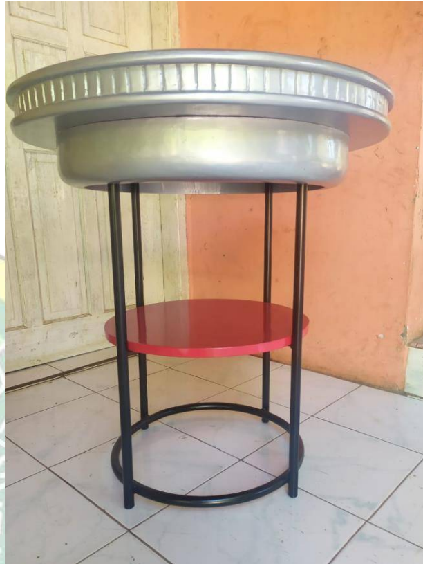
Gambar 4.6. Meja Kafe Motor CB