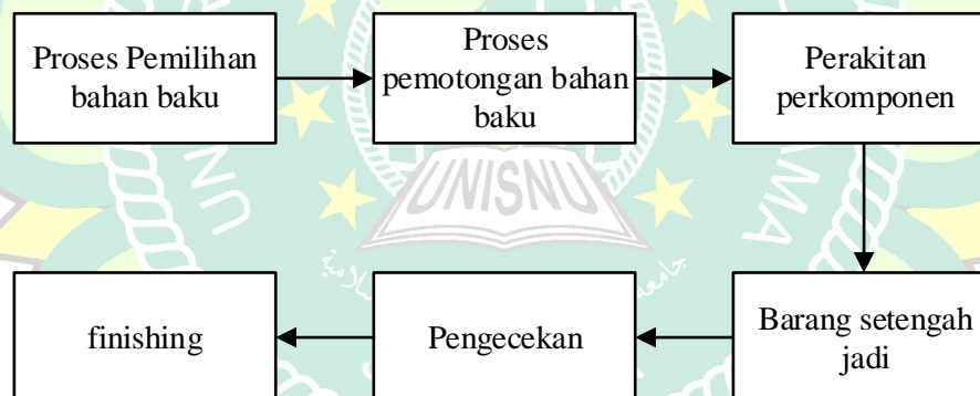
Gambar 3.2 Flowchart Produksi di CV Karunia Barokah

Proses produksi adalah proses berjalannya kegiatan produksi dimana bahan baku yang semula bahan mentah kemudian diproses atau dikerjakan melalui serangkaian kegiatan hingga menjadi bahan jadi. Kegiatan produksi yang berjalan di CV. Karunia Barokah dapat digambarkan seperti bagan sebagai berikut: