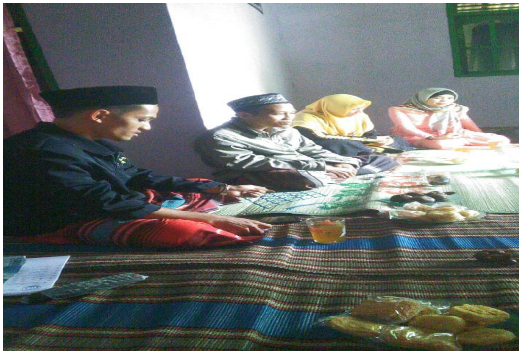
Gambar 4 : Pembacaan Maulid