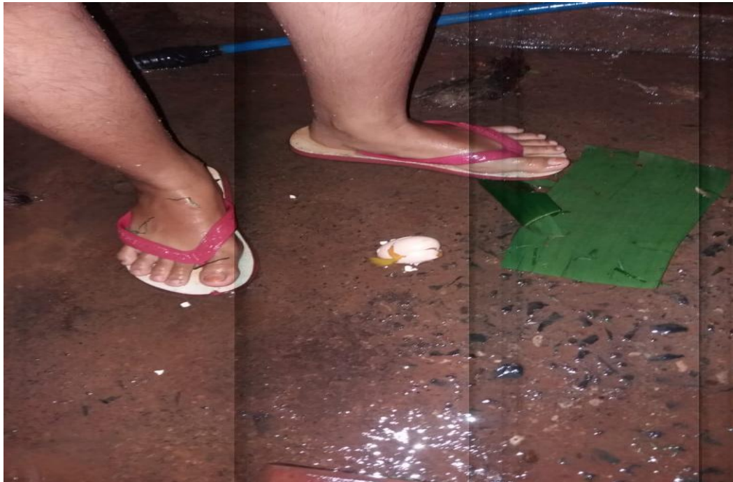
Gambar 3 : Prosesi brojolan