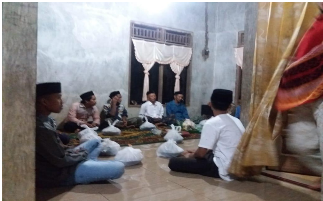
Gambar 6 : Pemberian brekat (oleh-oleh) pada masyarakat