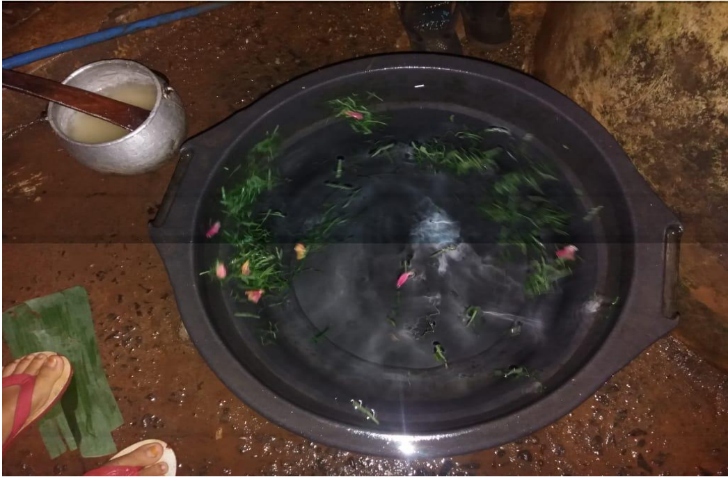
Gambar 1 : Penyiapan bahan untuk acara siraman