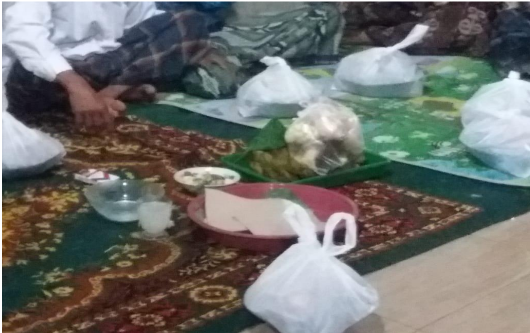
Gambar 5 : Pembacaan tahlil