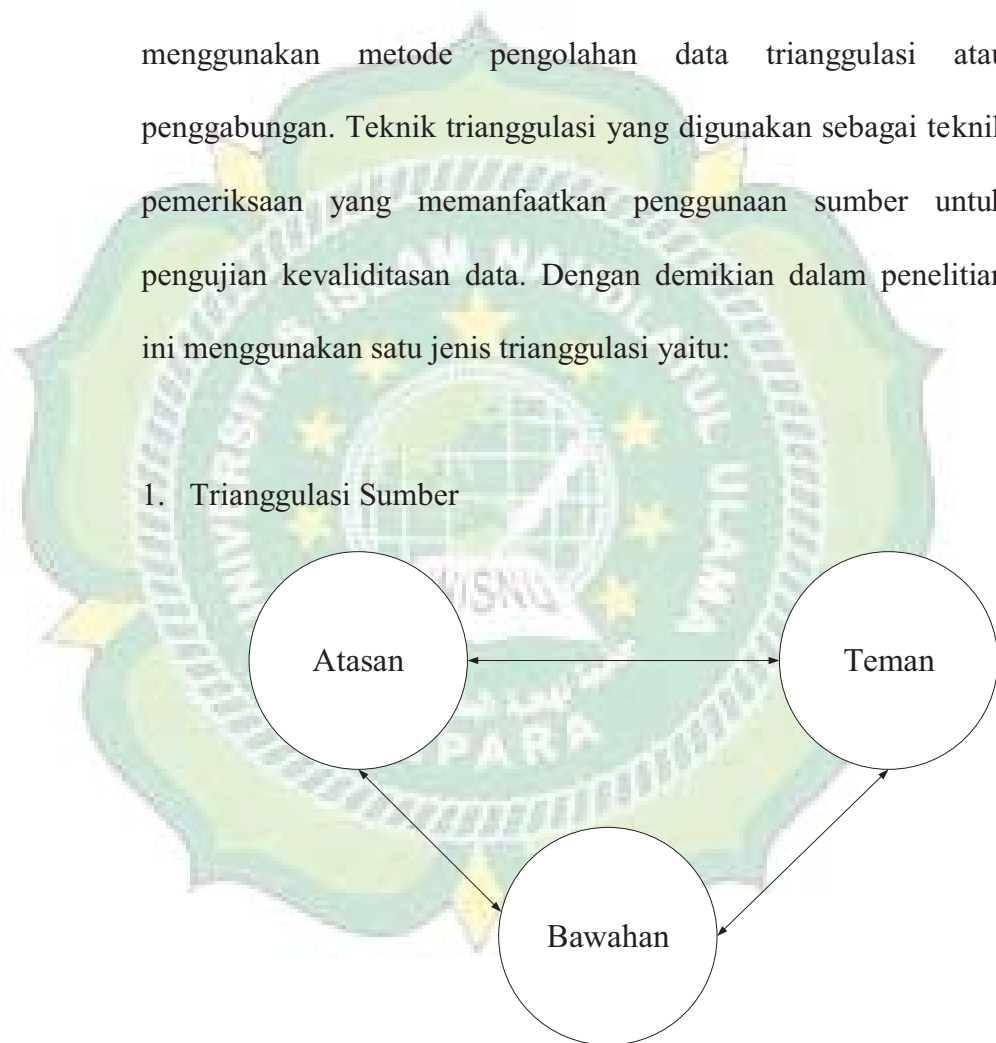
Gambar 3.1. Triangulasi Sumber

Untuk menguji kredibilitas dilakukan dengan cara mengecek data yang telah diperoleh melalui beberapa sumber.