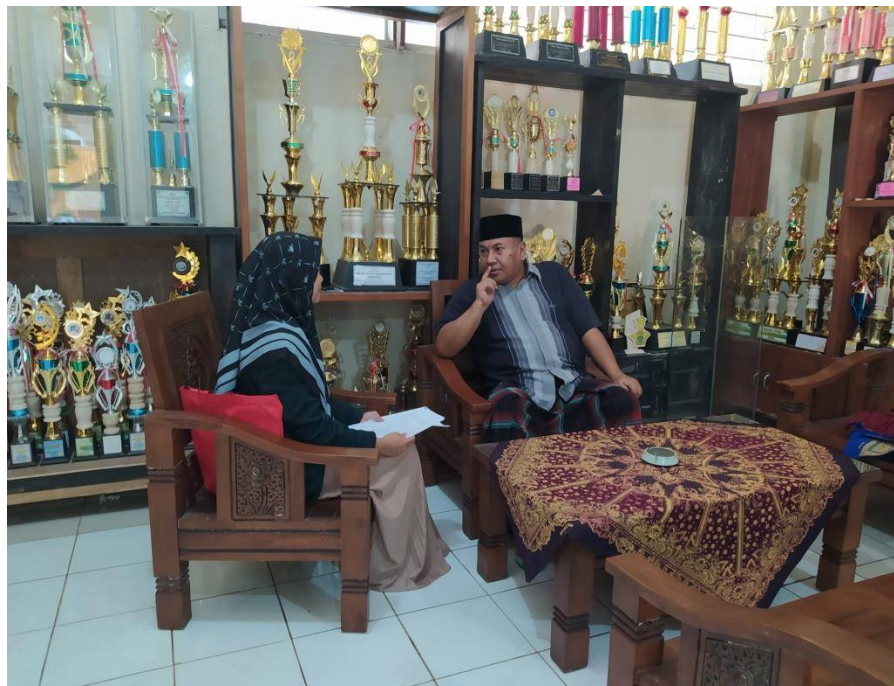
Gambar 2 Dokumentasi wawancara dengan kepala madrasah