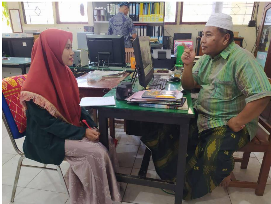
Gambar 1 Dokumentasi wawancara dengan kepala madrasah