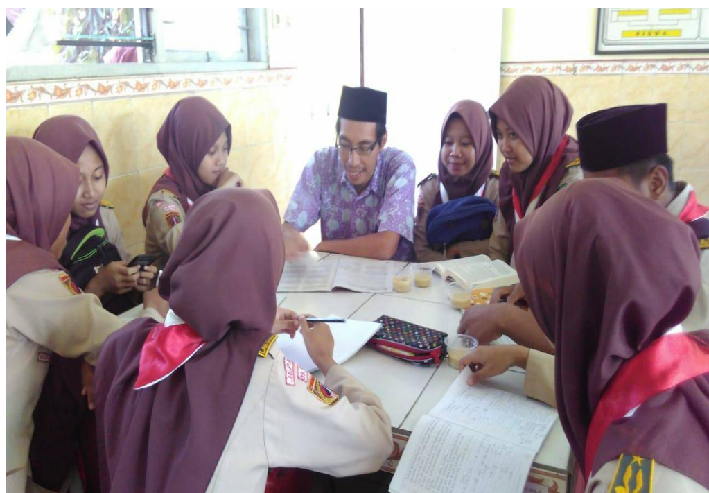
Gambar 6 Dokumentasi Kegiatan Siswa Mengikuti KDR