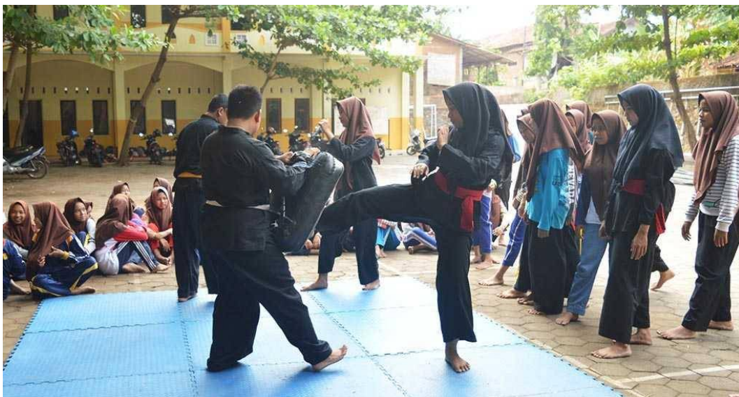
Gambar 4 Dokumentasi kegiatan siswa mengikuti Pencak silat