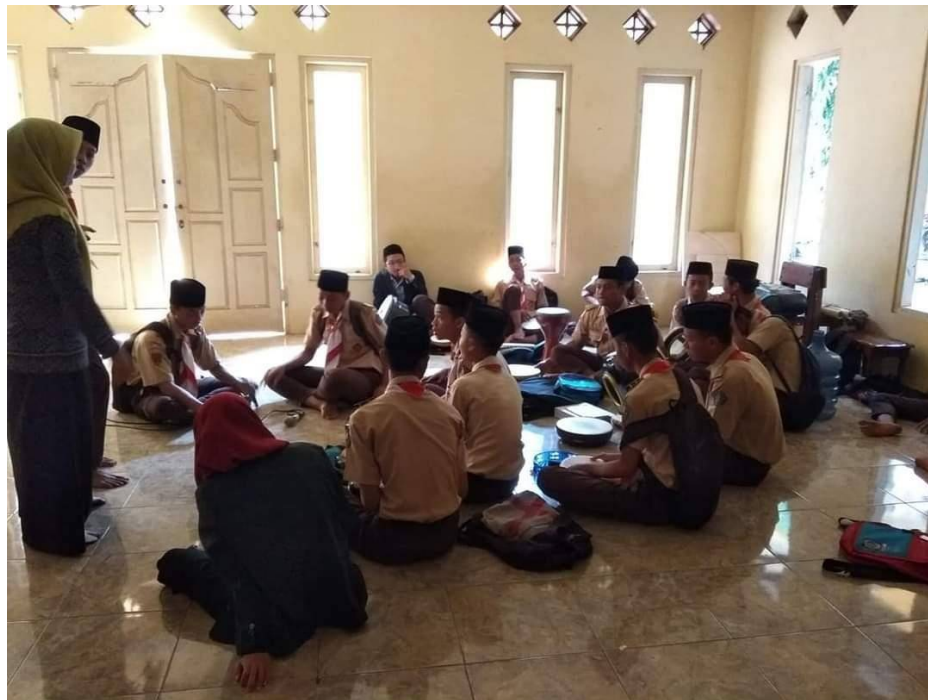
Gambar 7 Dokumentasi Kegiatan Siswa Mengikuti Rebaana