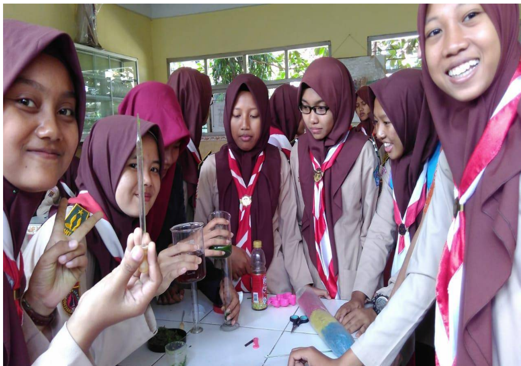
Gambar 5 Dokumentasi Kegiatan Siswa Mengikuti KPR