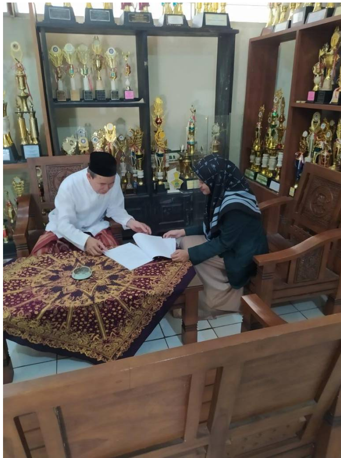
Gambar 3 Dokumentasi Diskusi dengan Waka kurikulum