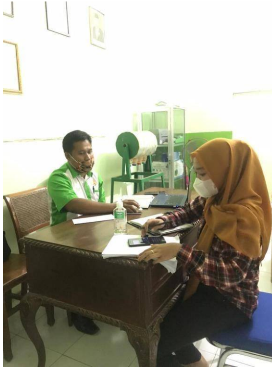
Gambar 02. Wawancara dengan Marketing Funding BMT Lumbang Artho