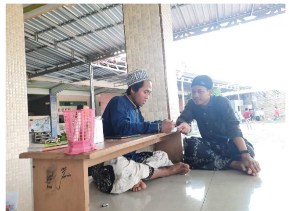
Wawancara dengan Ketua RT dan Petugas Pahala Megah