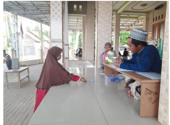
Pembayaran Angsuran Pinjaman Sosial Pahala Megah