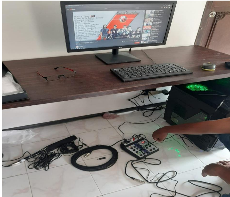
( Obervasi di dutaislam.com )