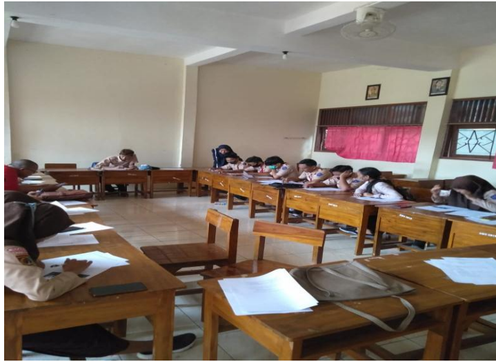
Gambar.3 Pesrta Didik Saat Menggerjakan Soal