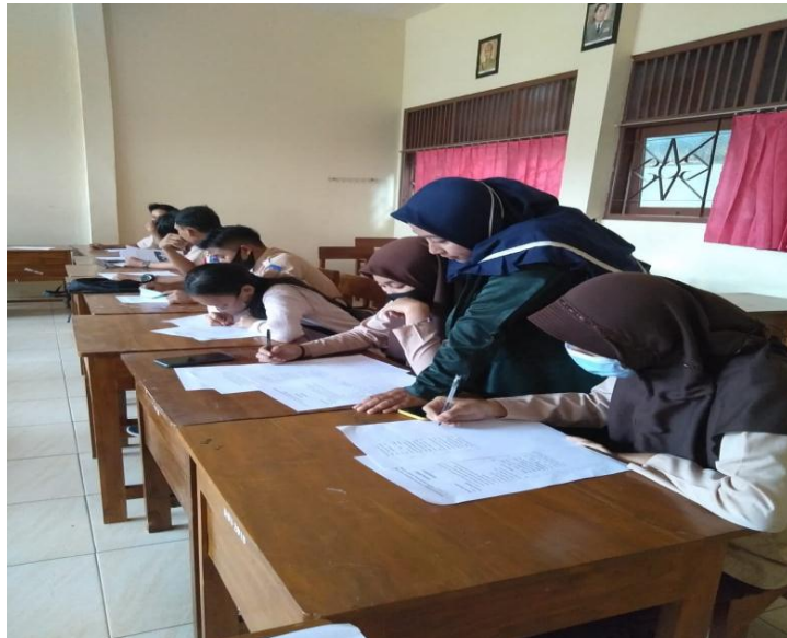
Gambar.4 Pendampingan Peserta Didik Saat Mengejakan Soal Tes