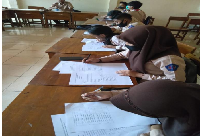
Gambar.1 Peserta Didik Melaksanakan Pengisian Angket