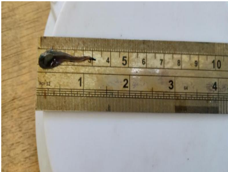
Gambar 2 Dokumentasi pengukuran panjang dan berat hewan uji

Lampiran 3 Dokumentasi pengukuran panjang dan berat hewan uji.