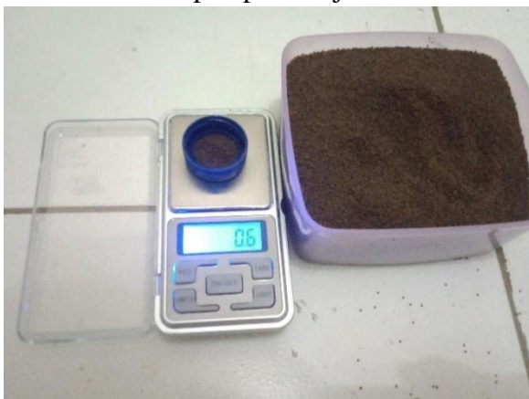
Gambar 6 Persiapan pakan uji