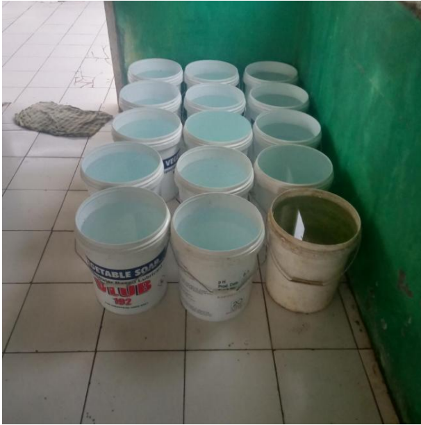
Gambar 1 Dokumentasi persiapan media penelitian.