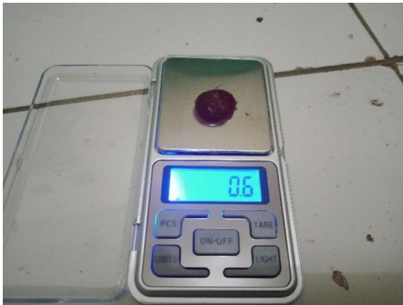
Gambar 4 Persiapan pakan uji