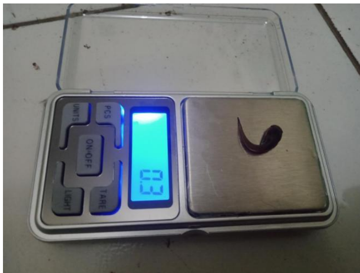
Gambar 3 Dokumentasi pengukuran panjang dan berat hewan uji.