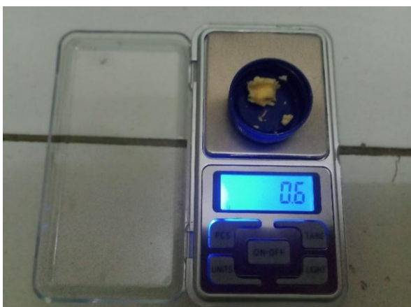
Gambar 5 Persiapan pakan uji