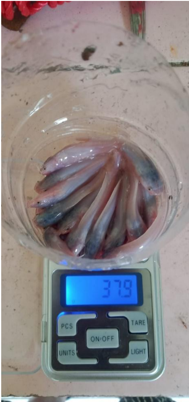
Gambar 10 Penimbangan hewan uji.