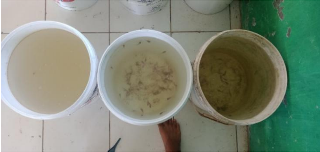
Gambar 7 Dokumentasi kualitas air