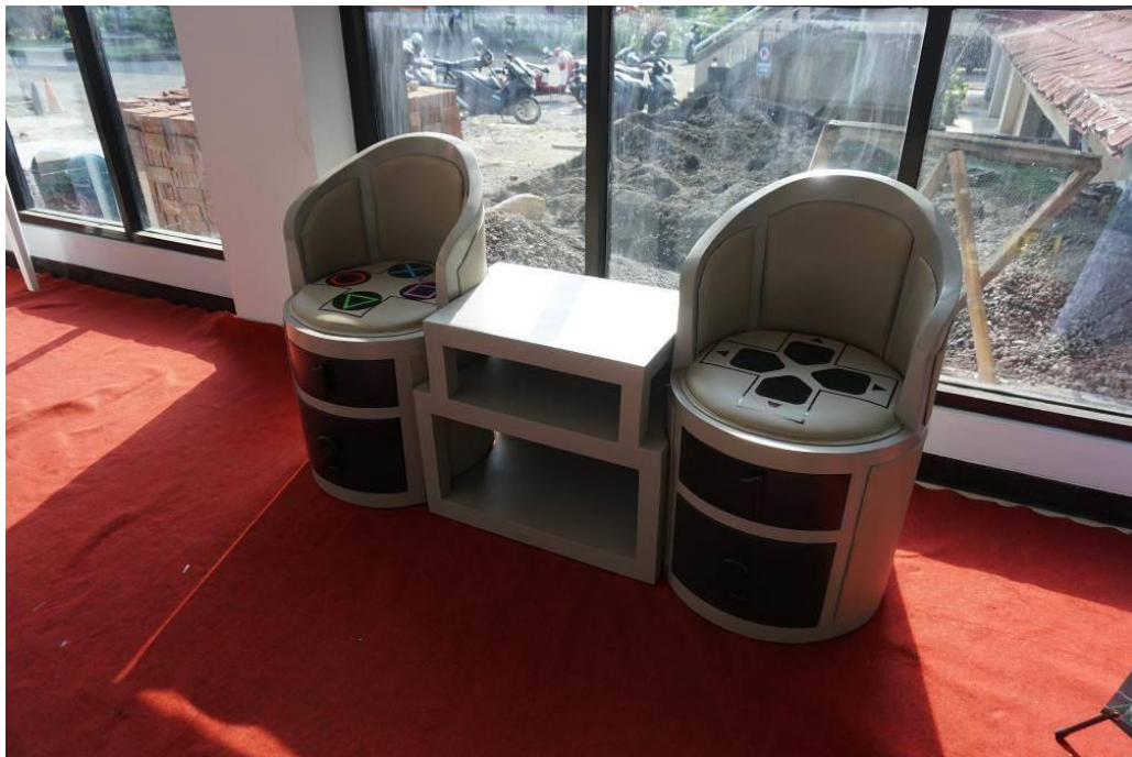
Gambar 5.2. Display Kursi Teras Kontroler Playstation.