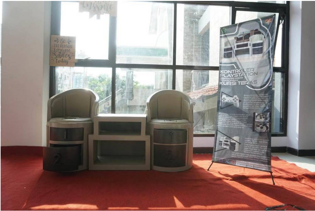
Gambar 5.1. Display Kursi Teras Kontroler Playstation.