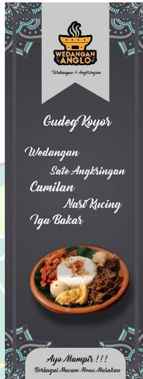
Gambar 4.5 X- Banner Wdangan Anglo