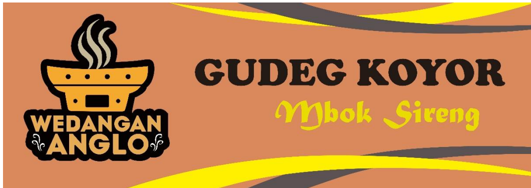
Gambar 4.4. Spanduk Wrdangan Anglo Sumber ( Wibowo:2021)