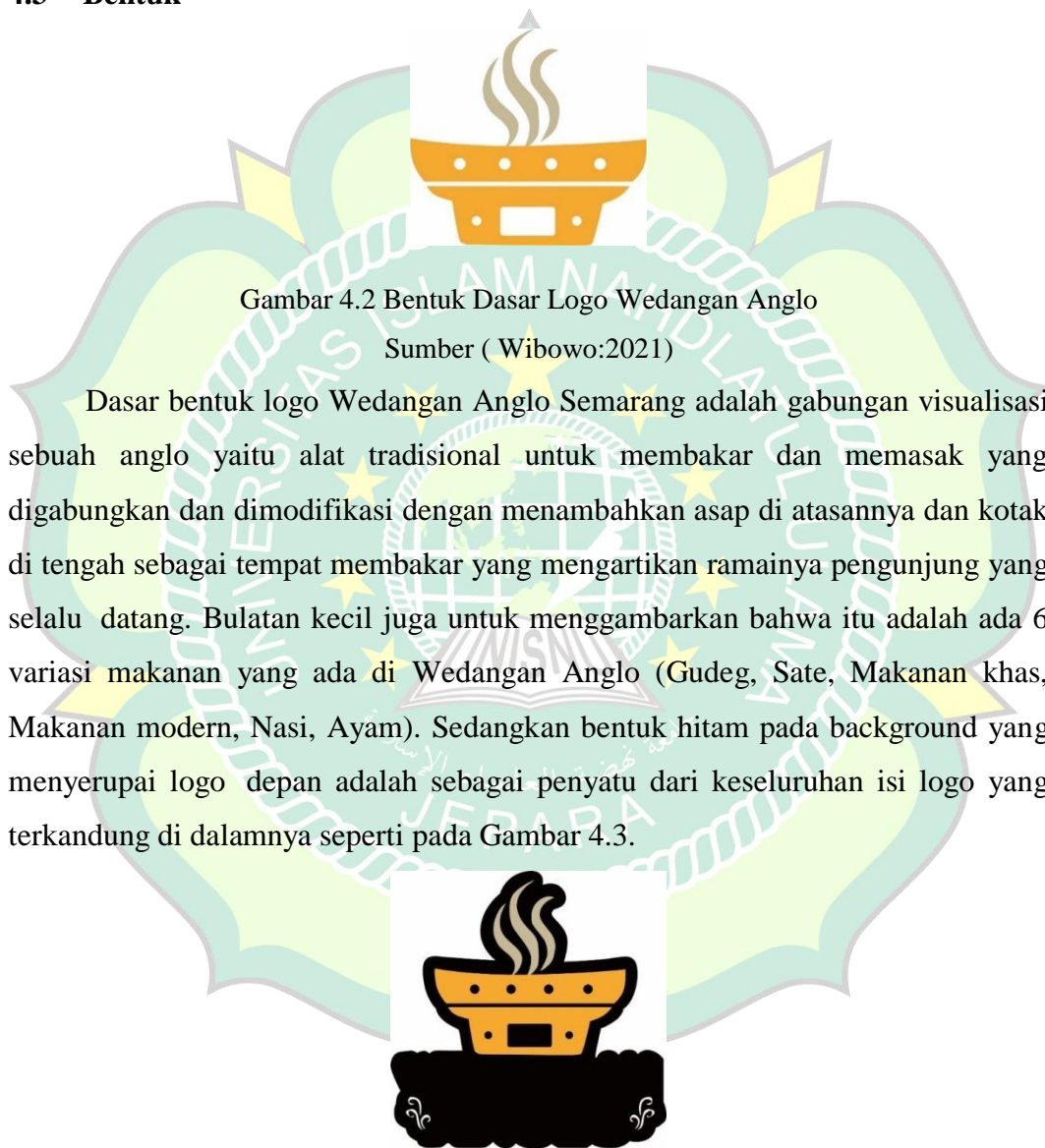
Gambar 4.3 Hasil Penambahan Bentuk Visualisasi Background dan Asap