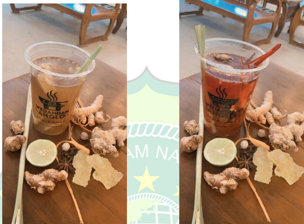
Gambar 4.6 Gelas Wedangan Anglo Sumber ( Wibowo:2021)