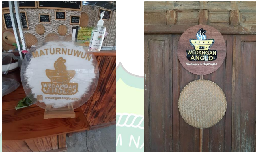
Gambar 4.7. Atribut Kayu dan Kaca Plastik Wdangan Anglo