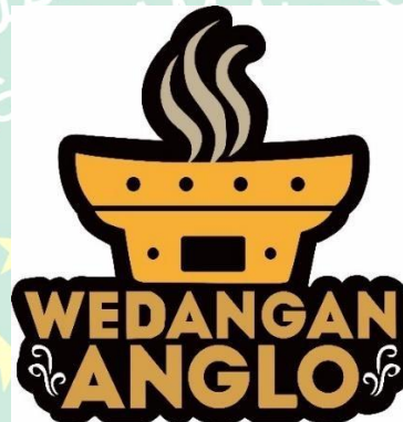
Gambar 4.1 Hasil Perancangan Logo WEDANGAN ANGLO

Logo adalah elemen grafis yang berbentuk ideogram, simbol, emblem, ikon, tanda yang digunakan sebagai lambang sebuah brand. Logo yang digunakan ini menggunakan logogram dan di beri logotype di bawahnya, konsep yang digunakan minimalis dengan pewarnaan yang signifikan.