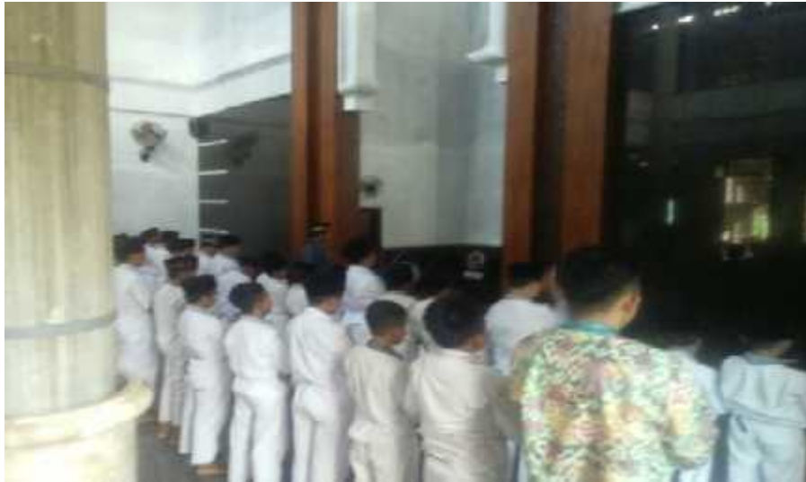
Kegiatan Jamaah Dhuhur