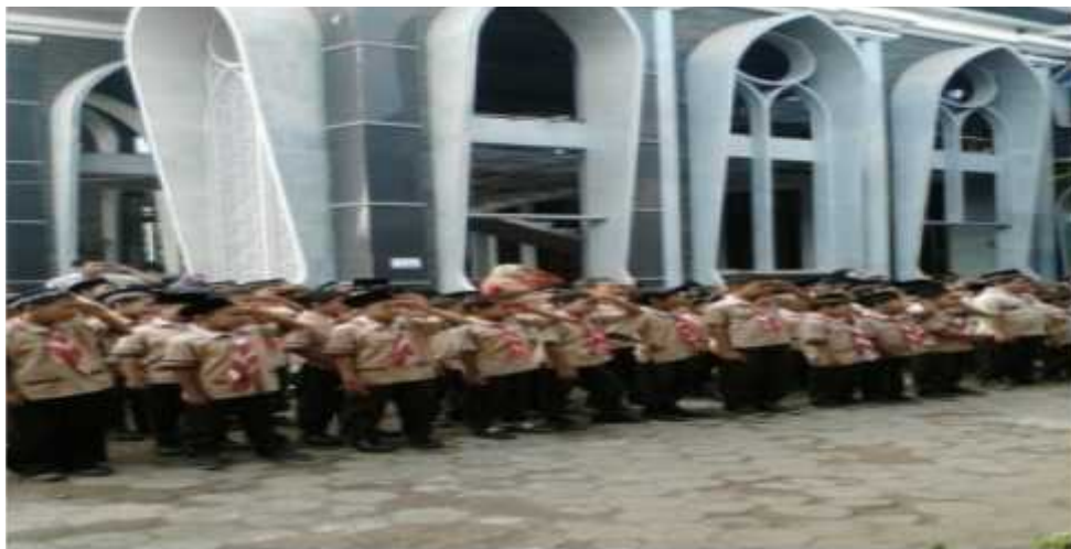
Halaman Madrasah Menyatu dengan Masjid