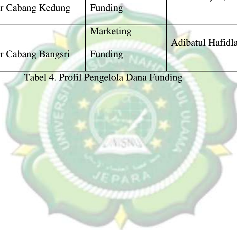
Tabel 4. Profil Pengelola Dana Funding