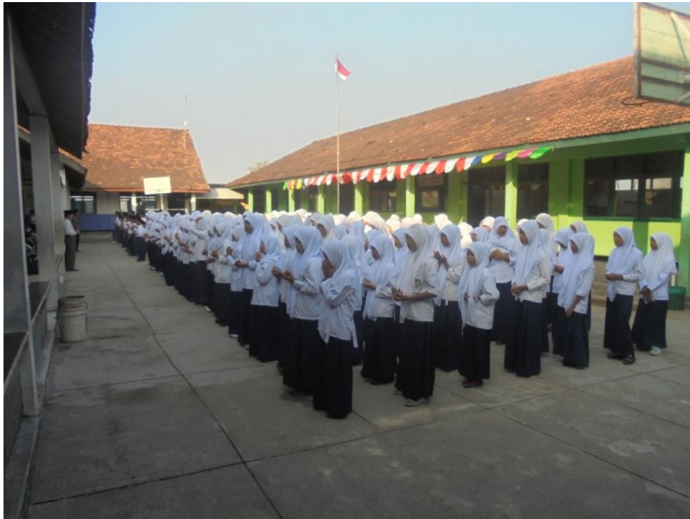
Gambar 5 : Kegiatan upacara Bendera