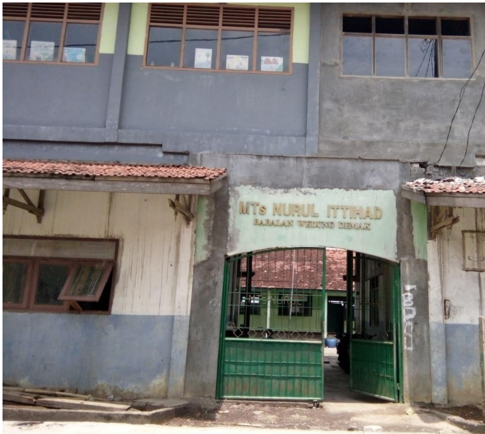
Gambar 1 : Madrasah dilihat dari luar