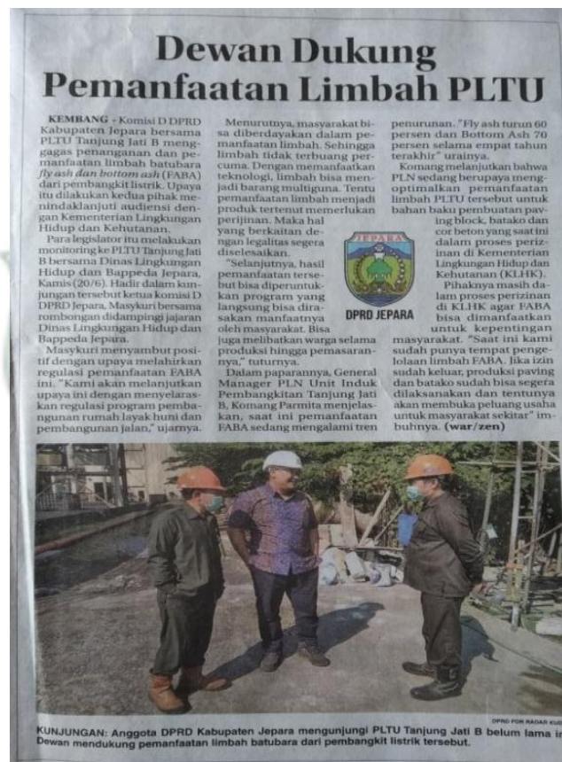
Gambar 3.6. Iklan Advertorial anggota DPRD Jepara Kunjungan ke PLTU Tanjung Jati B, Senin 24 Juni 2019

Iklan advertorial, jenis iklan yang menggunakan gaya bahasa jurnalistik, tujuan utama dari advertorial adalah untuk memperkenalkan serta mempromosikan kegiatan produk, instansi, atau jasa dari suatu perusahaan.