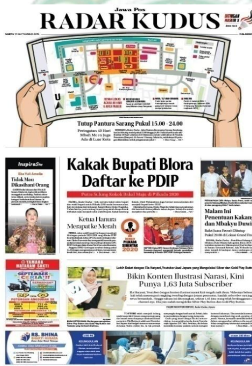
Gambar 3.1. Koran Jawa Pos Radar Kudus.

Jawa Pos merupakan koran distribusi lokal dengan berjalannya waktu koran ini, menjadi koran distribusi nasional terbesar di Indonesia. Meski demikian, Jawa Pos tetap tidak meninggalkan kekuatan lokal dan terus mengutamakan perhatian terhadap pengembangan koran di banyak daerah termasuk di Kudus.