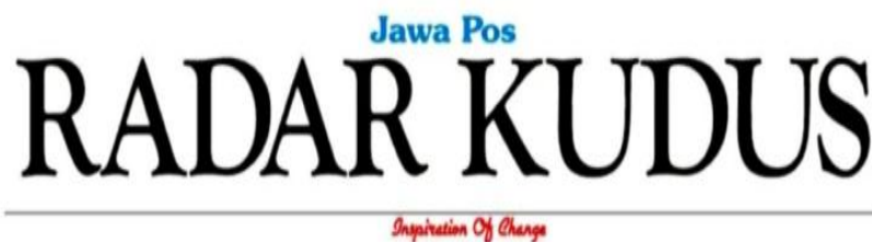
Gambar 3.3 Logo Perusahaan Jawa Pos Radar Kudus.

Selain visi dan misi, logo salah satu ornament yang menguatkan identitas suatu perusahaan terlebih yang bergerak dibidang media, lebih tepatnya media massa cetak seperti logo harian umum Jawa Pos Radar Kudus dibawah ini: