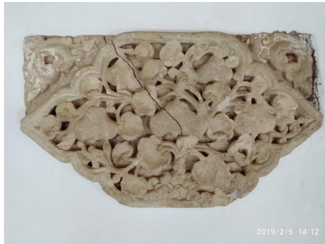
9. Gambar 09: Tumbuhan daun, kangkung dan nipah