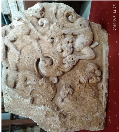
18. Gambar 18: Ornamen candrasengkala