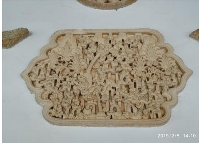
8. Gambar 08: Ornamen Sulur-suluran dan labu air