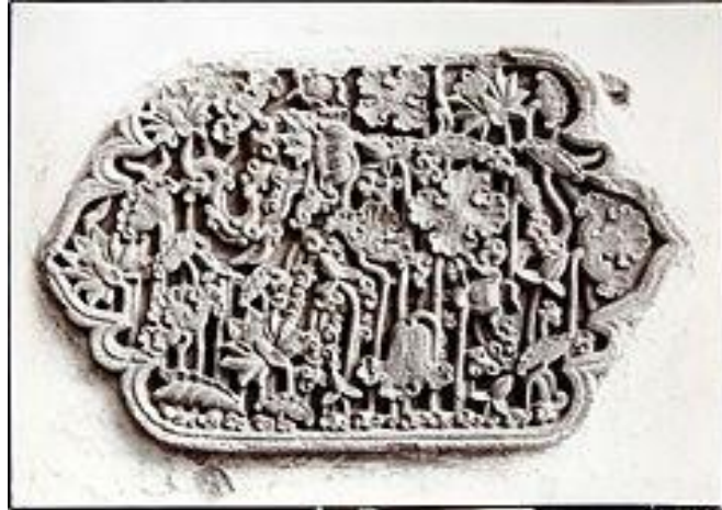
17. Gambar 17: Ornamen Relief dua Sisi berbentuk kera