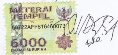
Nurul Ida Fitriyah