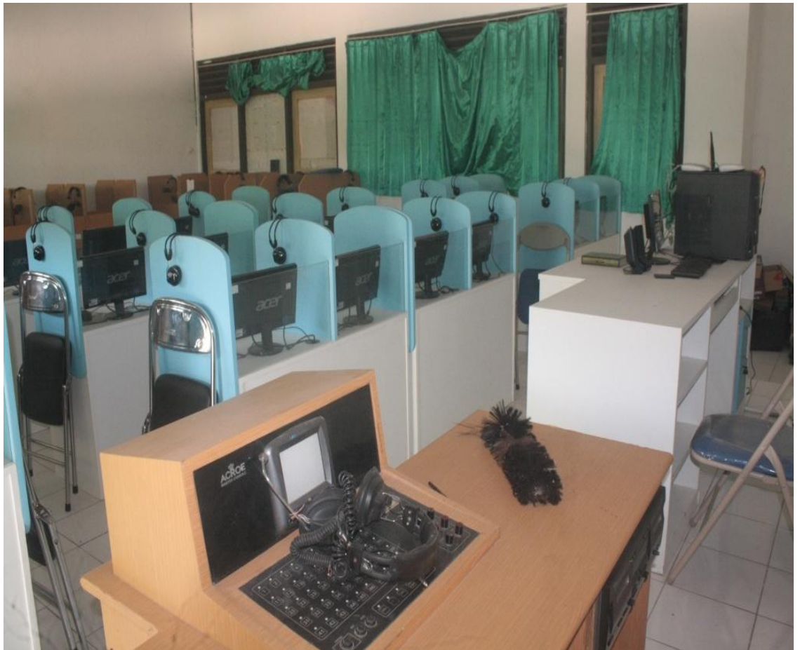
FOTO LEB BAHASA