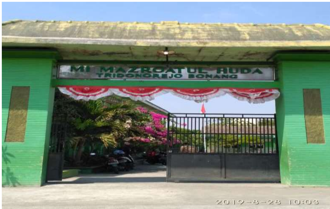
Gambar 01. Gapura pintu masuk MI Mazroatul Huda Tridinorejo Bonang Demak