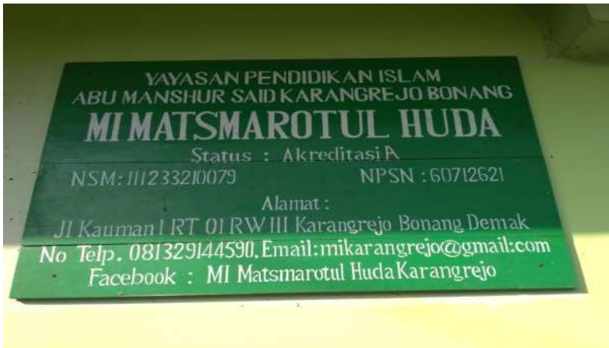
Gambar 07. Papan nama MI Matsmarotul Huda Karangrejo Bonang Demak