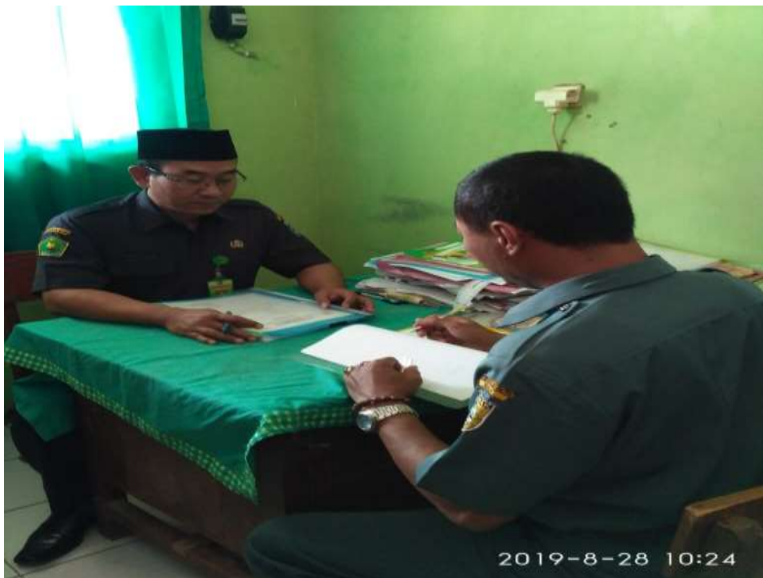
Gambar 14. Foto wawancara peneliti dengan Kepala MI Nurul Huda Kembangan Bonang Demak