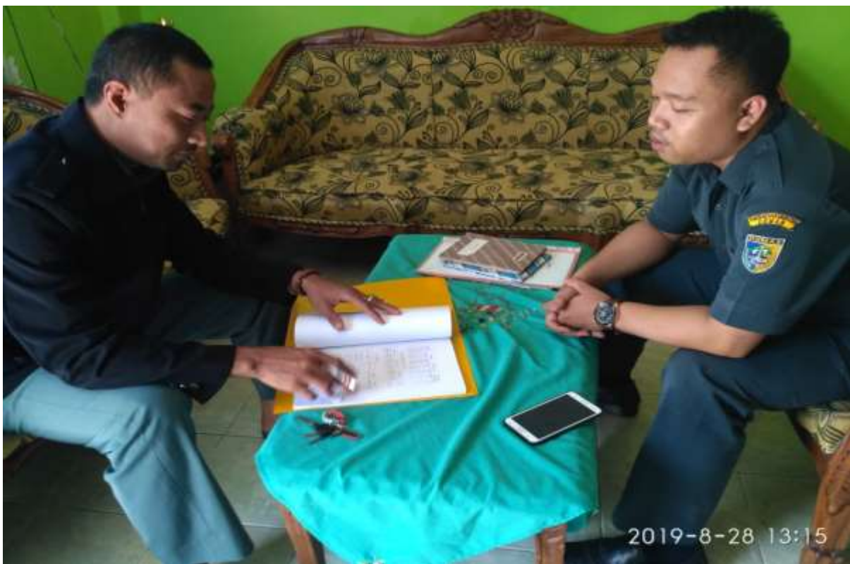
Gambar 10. Foto wawancara peneliti dengan Kepala MI Matsmarotul Huda Karangrejo Bonang Demak