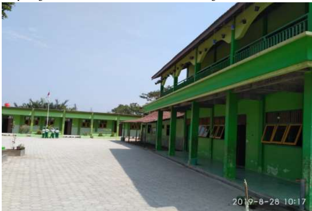
Gambar 11. Gedung MI Nurul Huda Kembangan Bonang Demak