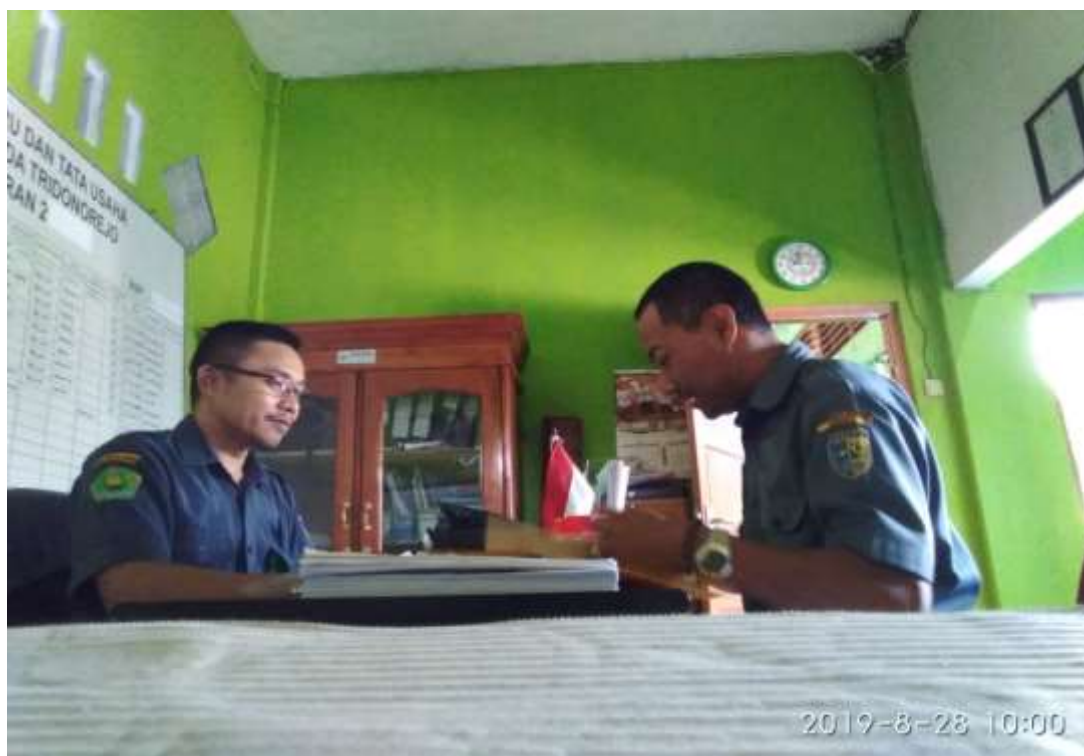
Gambar 06. Foto wawancara peneliti dengan Kepala MI Mazroatul Huda Tridonorejo Bonang Demak