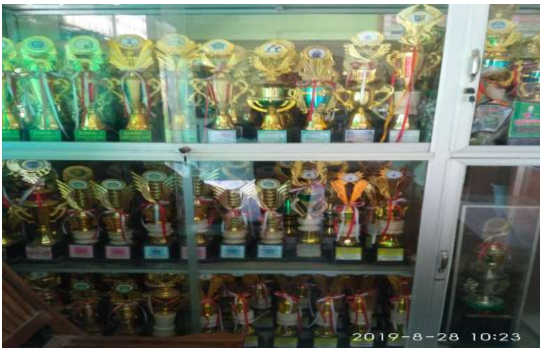
Gambar 16. Tropi dan piala hasil kompetisi dan lomba MI Nurul Huda Kembangan Bonang Demak