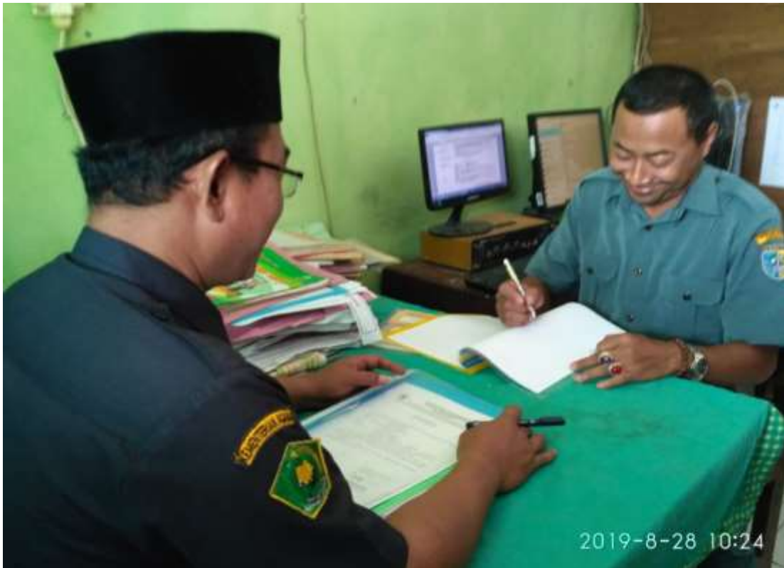
Gambar 15. Foto wawancara peneliti dengan Kepala MI Nurul Huda Kembangan Bonang Demak