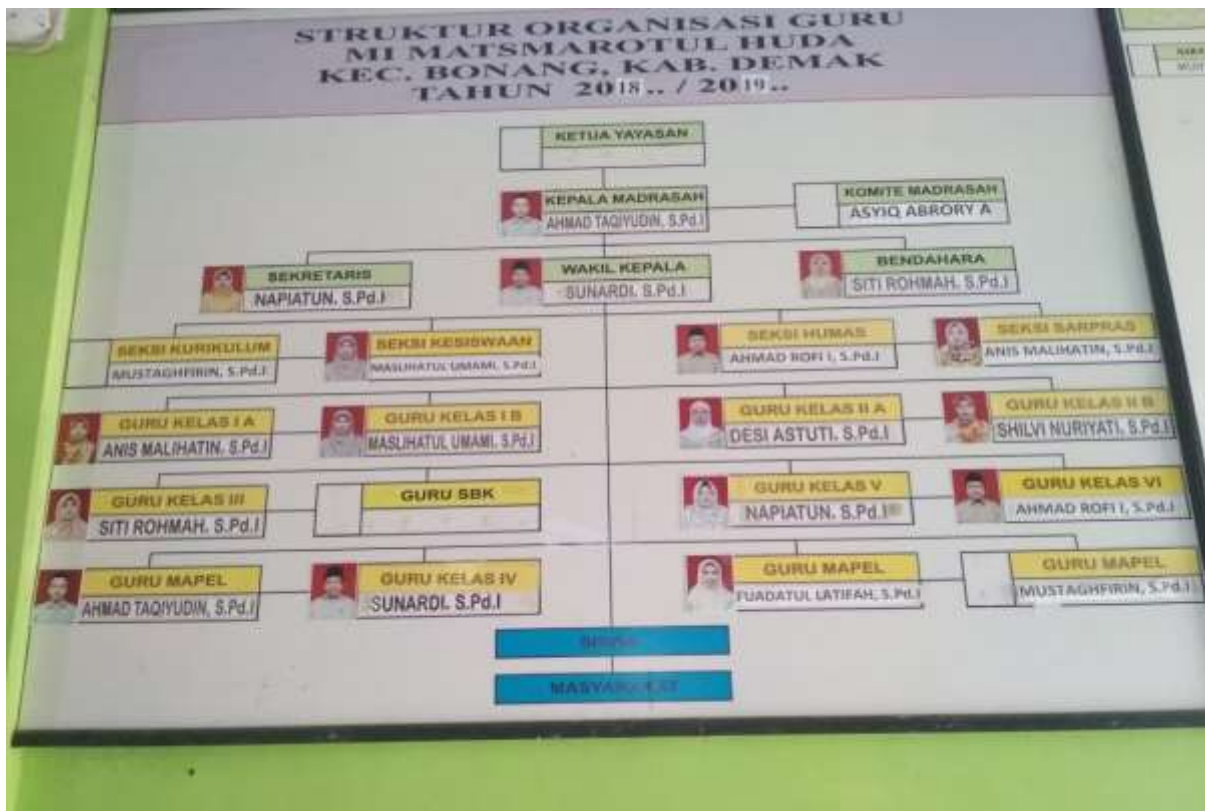
Gambar 08. Struktur Organisasi MI Matsmarotul Huda Karangrejo Bonang Demak