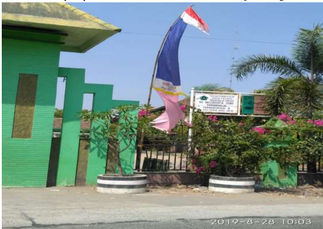
Gambar 02. Papan Nama MI Mazroatul Huda Tridonorejo Bonang Demak