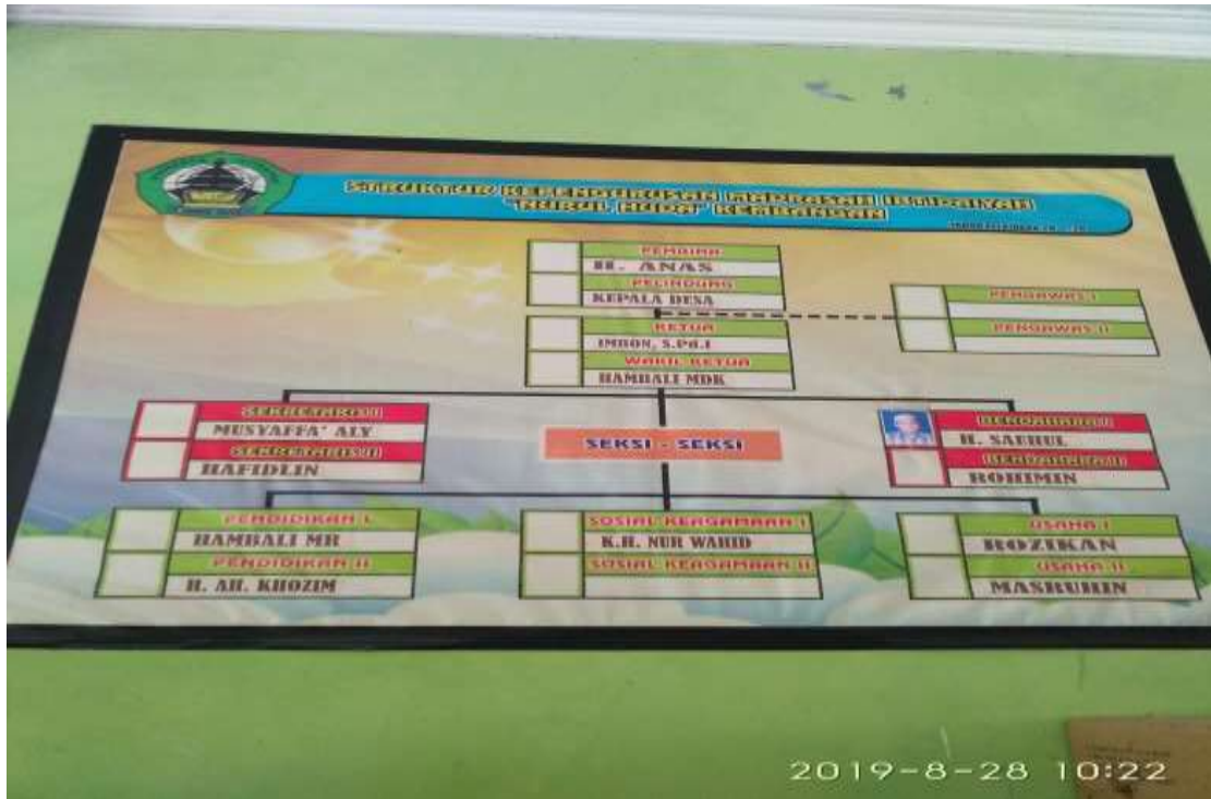
Gambar 13. Struktur organisasi MI Nurul Huda Kembangan Bonang Demak