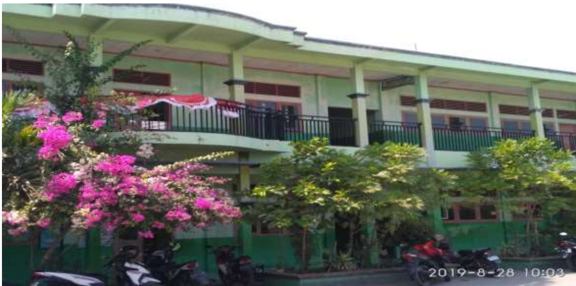
Gambar 03. Gedung MI Mazroatul Huda Tridonorejo Bonang Demak