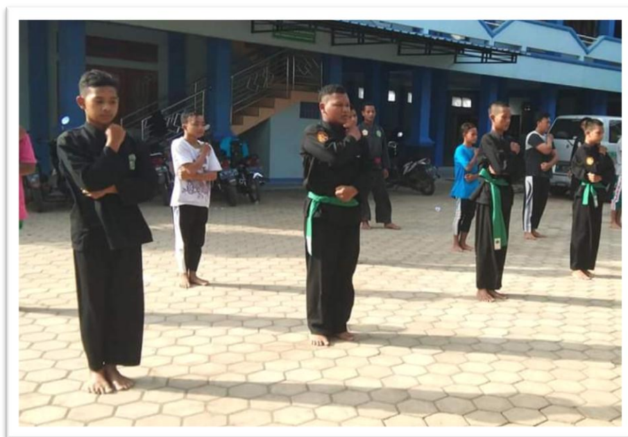
Gambar 9 Kegiatan Ekstrakurikuler Pencak Silat