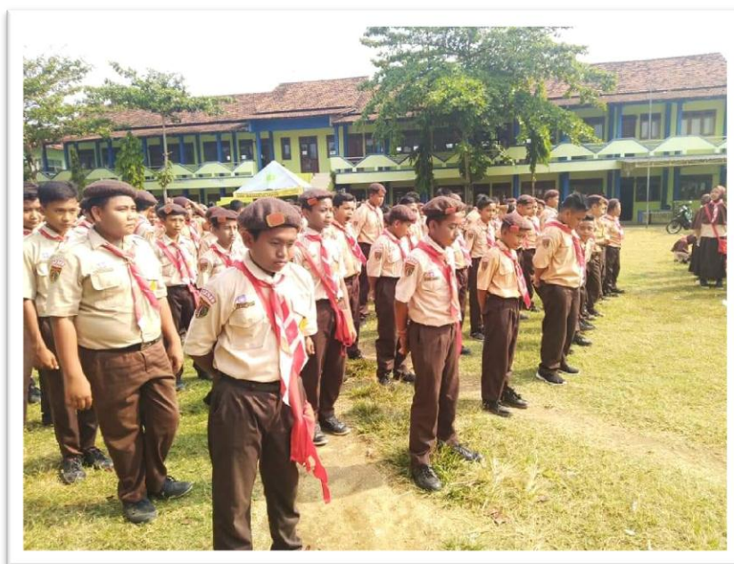
Gambar 10 Kegiatan Ekstrakurikuler Pramuka