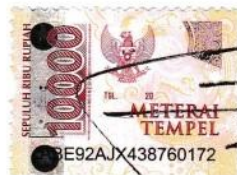
Fuad Fahmi Latif