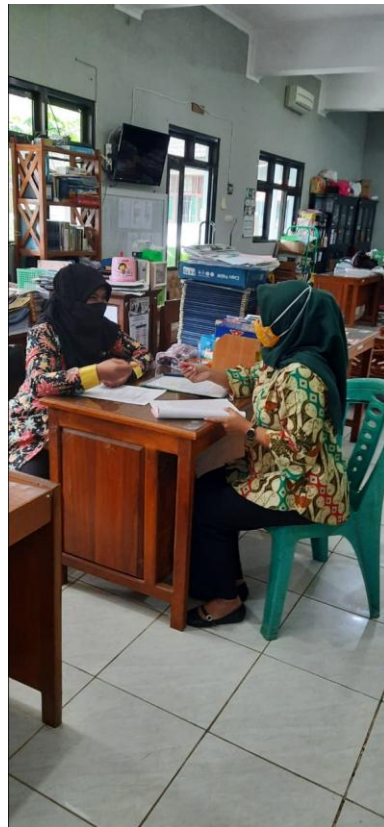
Dokumentasi Wawancara dengan Pembina Ekstrakurikuler PMR SMK N 1 Jepara