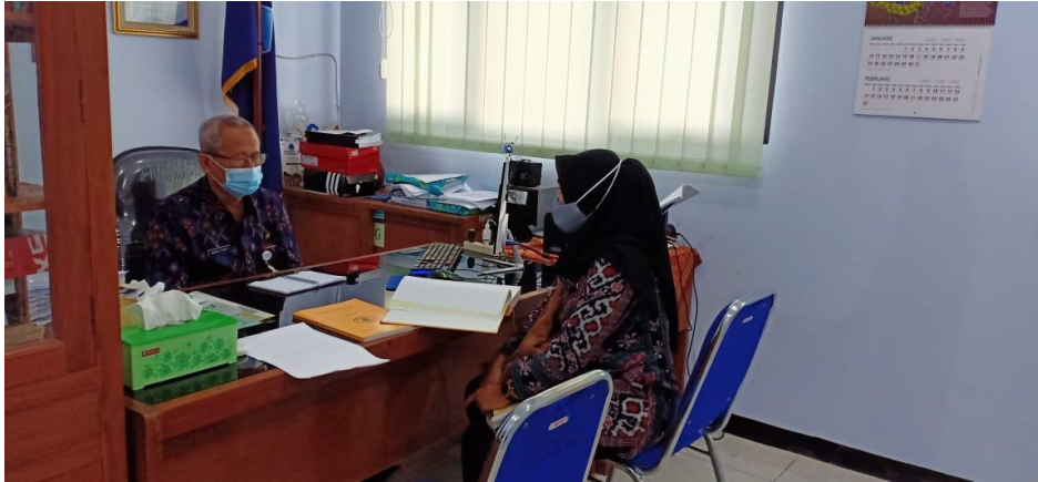
Dokumentasi Wawancara dengan Kepala SMK N 1 Jepara