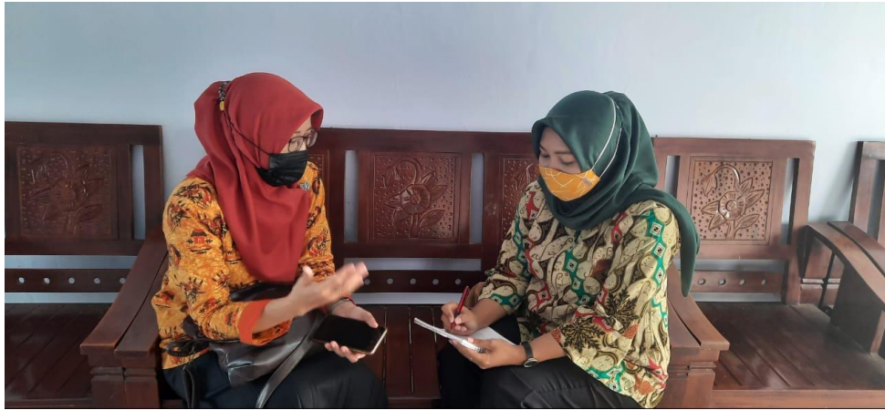
Dokumentasi Wawancara dengan Pembina Ekstrakurikuler Pramuka SMK N 1 Jepara