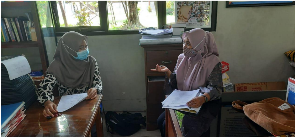
Dokumentasi Wawancara dengan Wali Kelas SMK N 1 Jepara