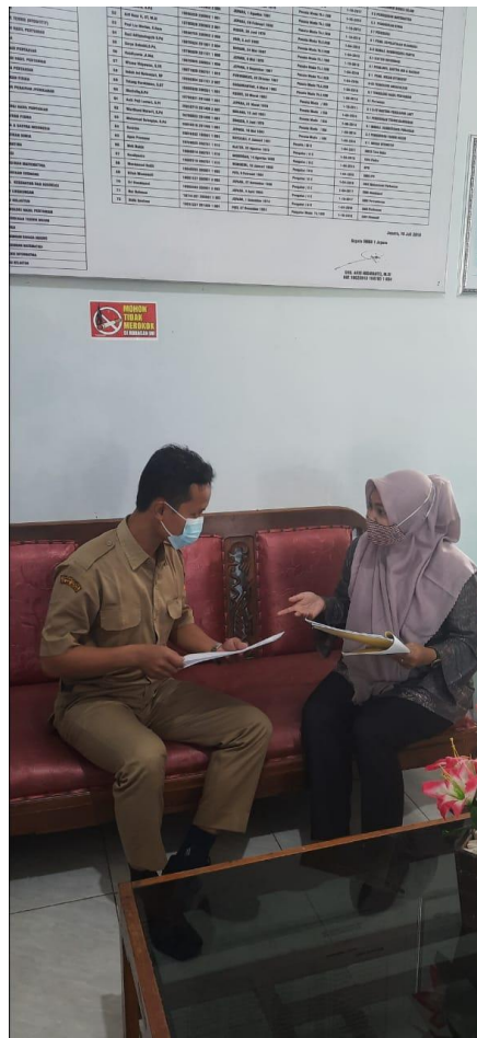
Dokumentasi Wawancara dengan Pembina Ekstrakurikuler PKS SMK N 1 Jepara