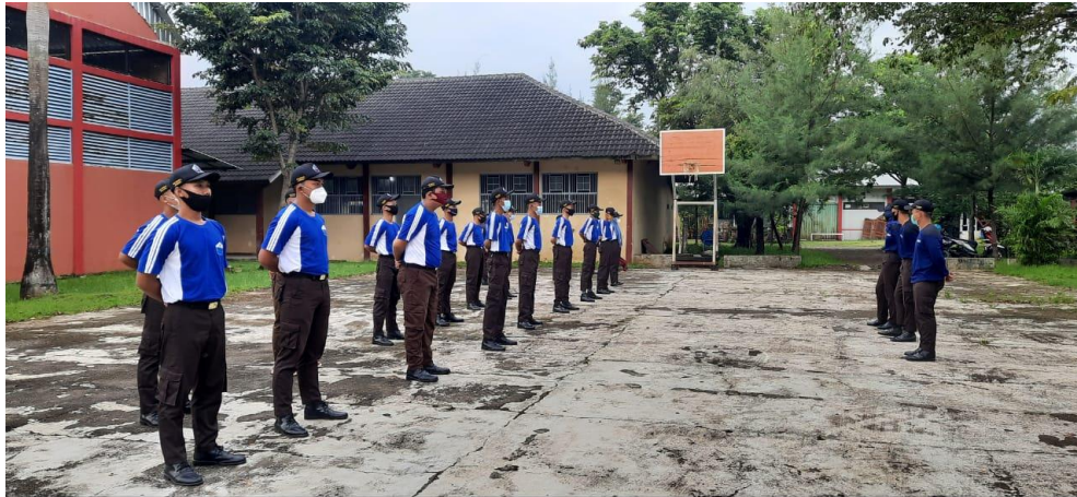
Dokumentasi Kegiatan Ekstrakurikuler pada Masa Pandemi