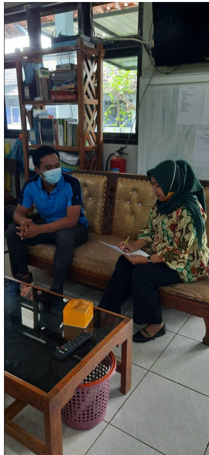
Dokumentasi Wawancara dengan Waka Kesiswaan SMK N 1 Jepara