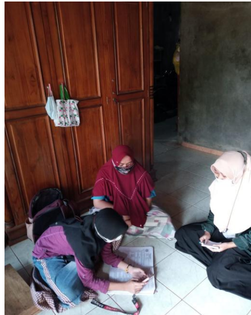
Gambar 3 Orang tua dan