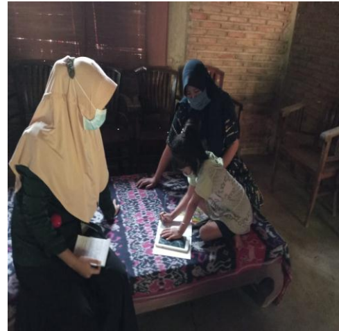
Gambar 4 Orang tua dan Peserta didik