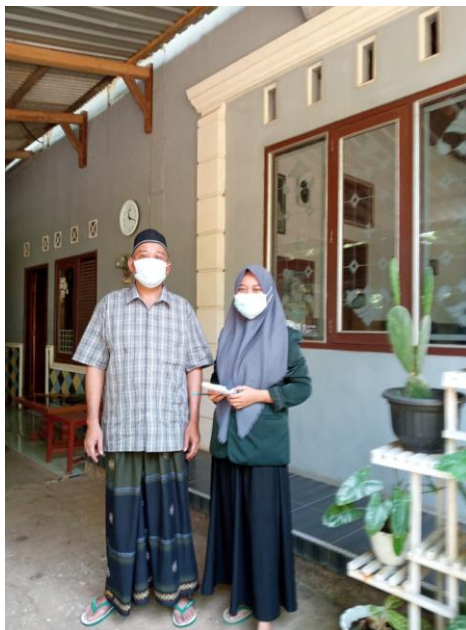
Gambar 2 Pendidik AQIDAH AKHLAK siswa