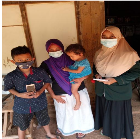
Gambar 3 Orang tua dan Peserta didik