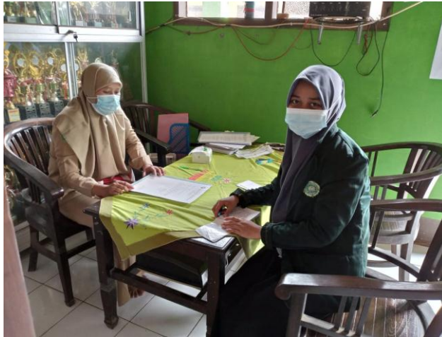
Gambar 1 Kepala Sekolah MI Matholiul Huda 02 Troso