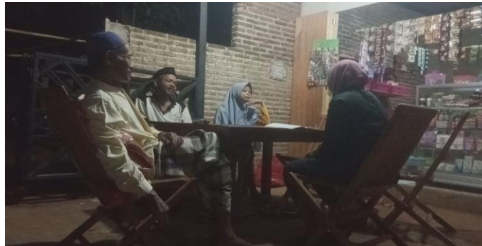
Wawancara dengan Ketua RT Di desa Kedungcino Jepara