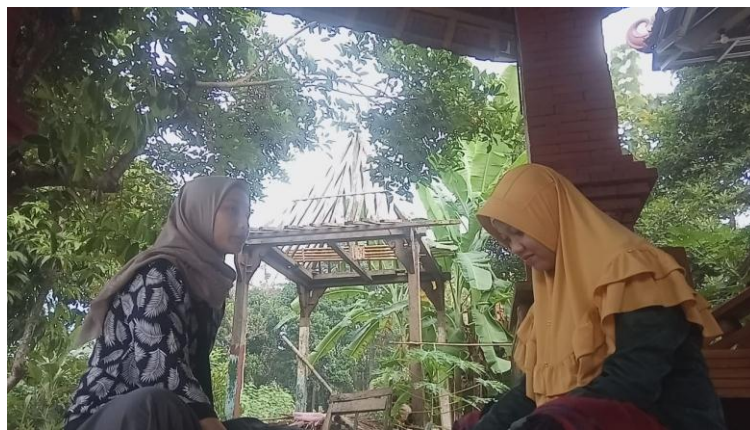
Wawancara dengan warga Desa Kedungcino Jepara