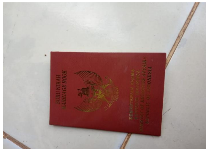
Bukti Buku Nikah