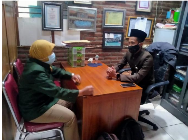
Kegiatan wawancara dengan Kepala Sekolah SD Unggulan Terpadu Bumi Kartini Jepara