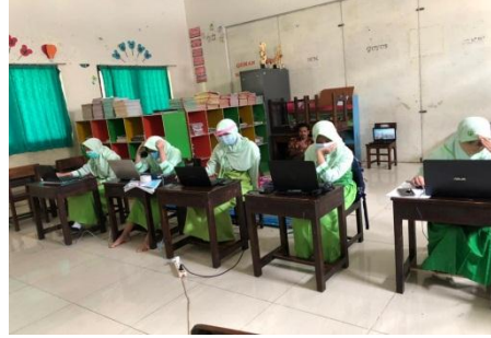
Kegiatan Olimpiade Mata Pelajaran Pendidikan Agama Islam secara daring