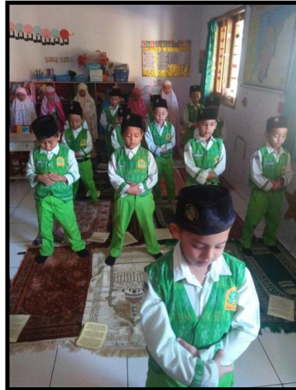
Shalat Dhuha, dhuhur, dan Ashar