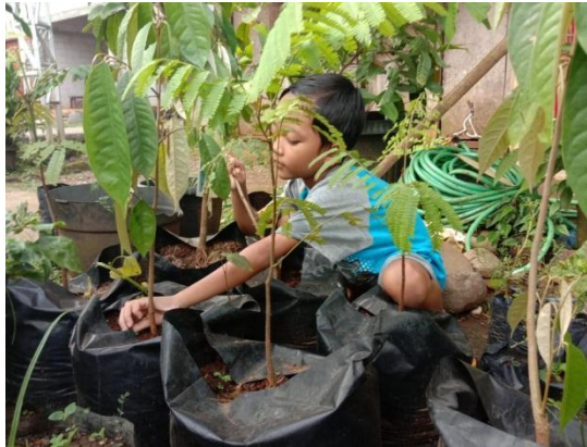
Pembiasaan Merawat Tumbuhan dan