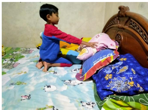
Pembiasaan Merapikan tempat Tidur