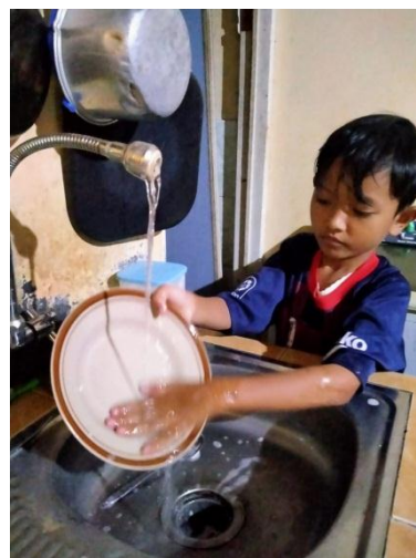
Pembiasaan Mencuci piring selesai makan