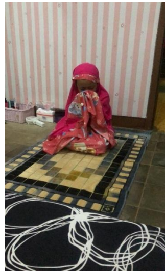
Kegiatan Disiplin sholat di rumah