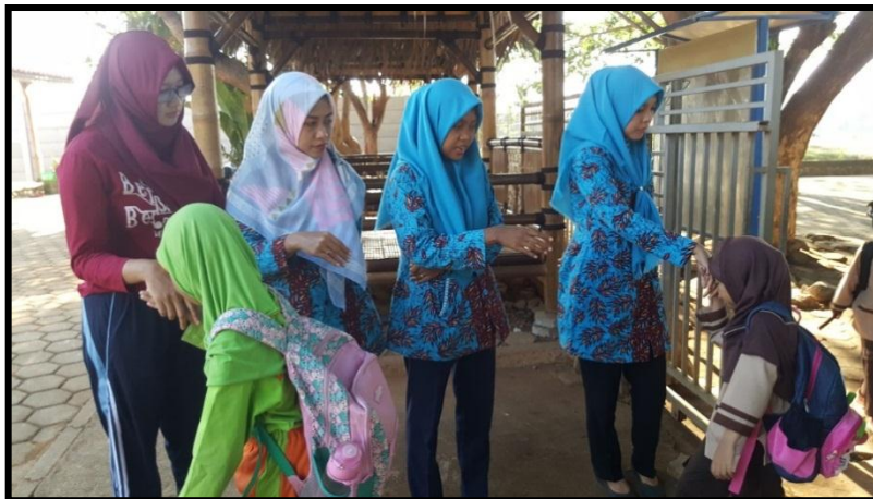
Menyambut siswa dengan bersalaman