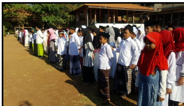
Upacara memperingati Hari Santri