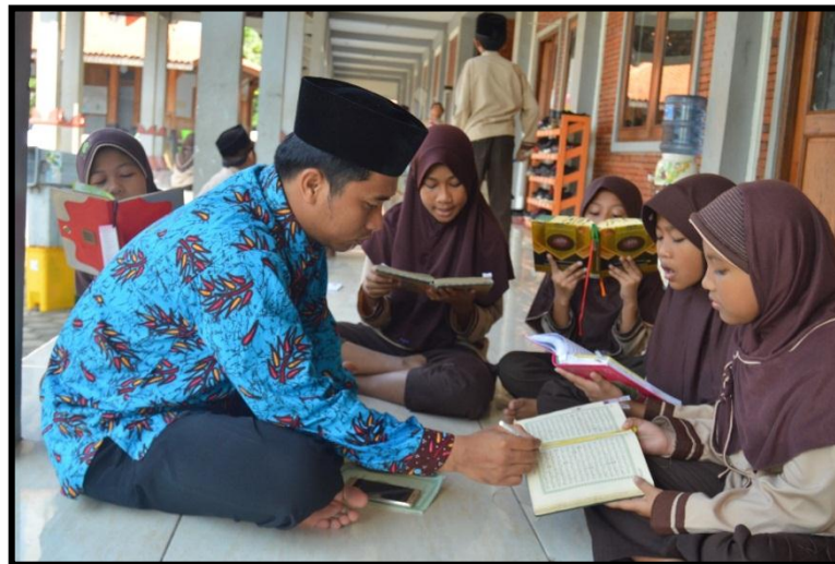
Mengaji dan setor hafalan