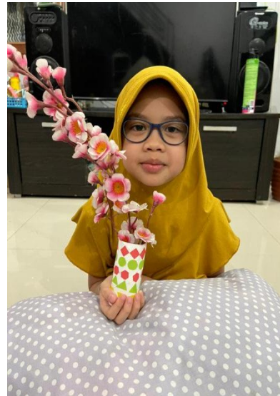
Disiplin mengirim tugas