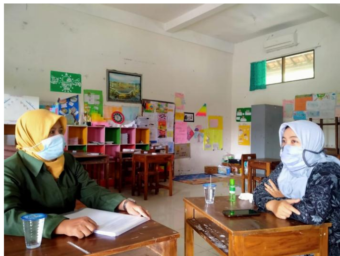
Kegiatan wawancara dengan guru Pendidikan Agama Islam SD Unggulan Terpadu Bumi Kartini Jepara