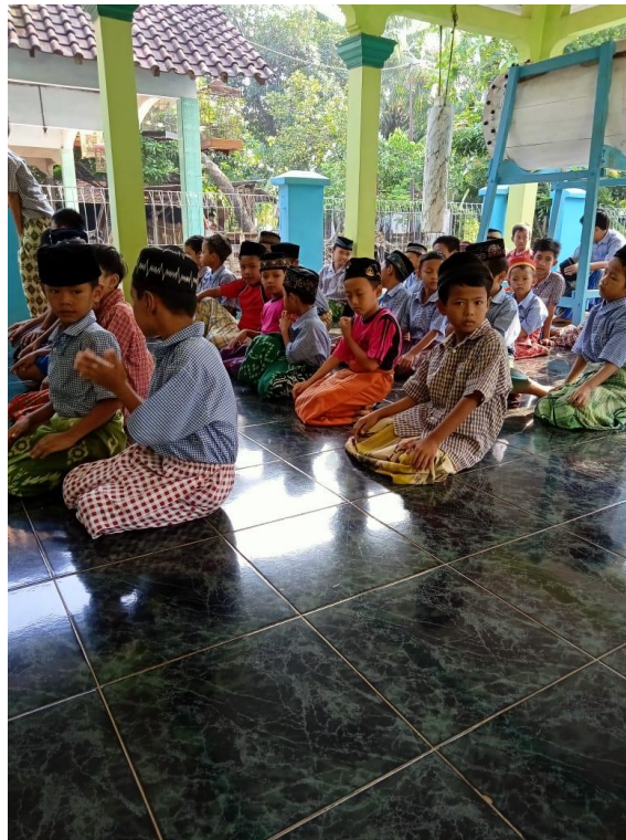
Kegiatan Pembelajaran Materi Sholat Tarawih