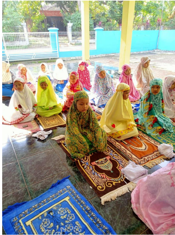
Kegiatan Pembelajaran Materi Sholat Tarawih