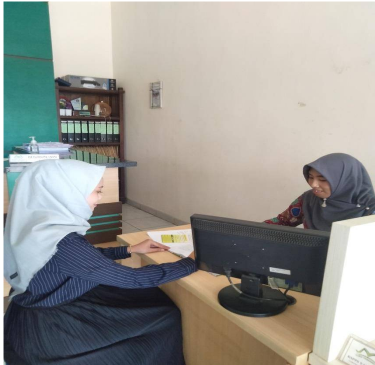
Gambar 01. Wawancara dengan Marketing Funding KSPPS BMT Yamamus