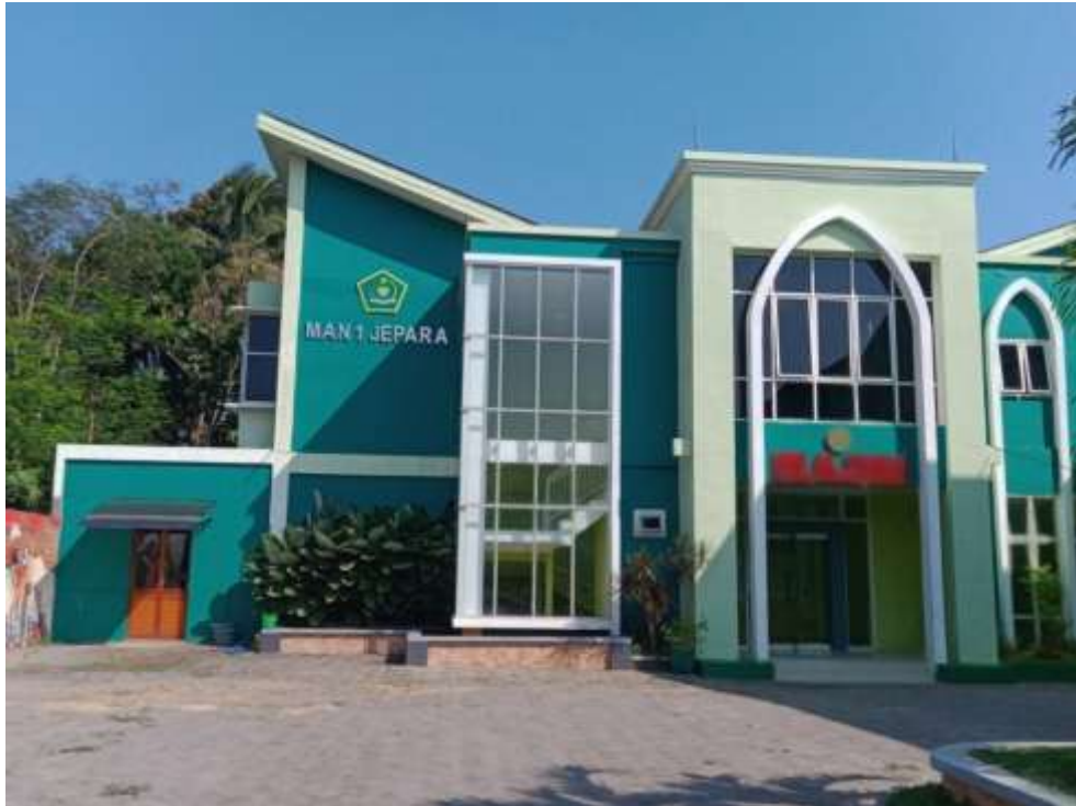
Gedung Asrama Siswa