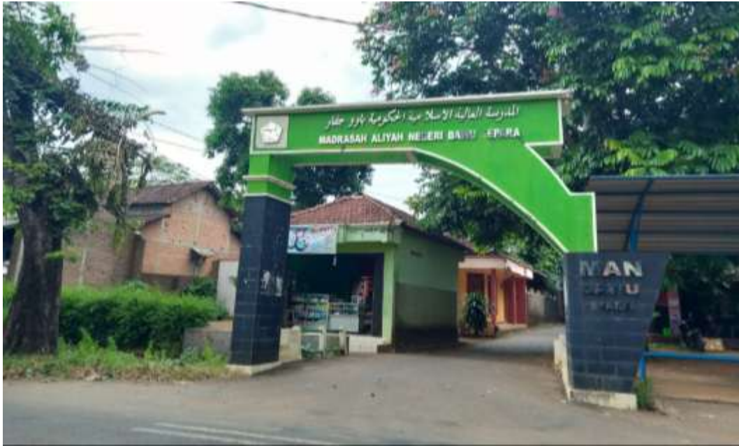
Tampak depan MAN 1 Jepara yang lama