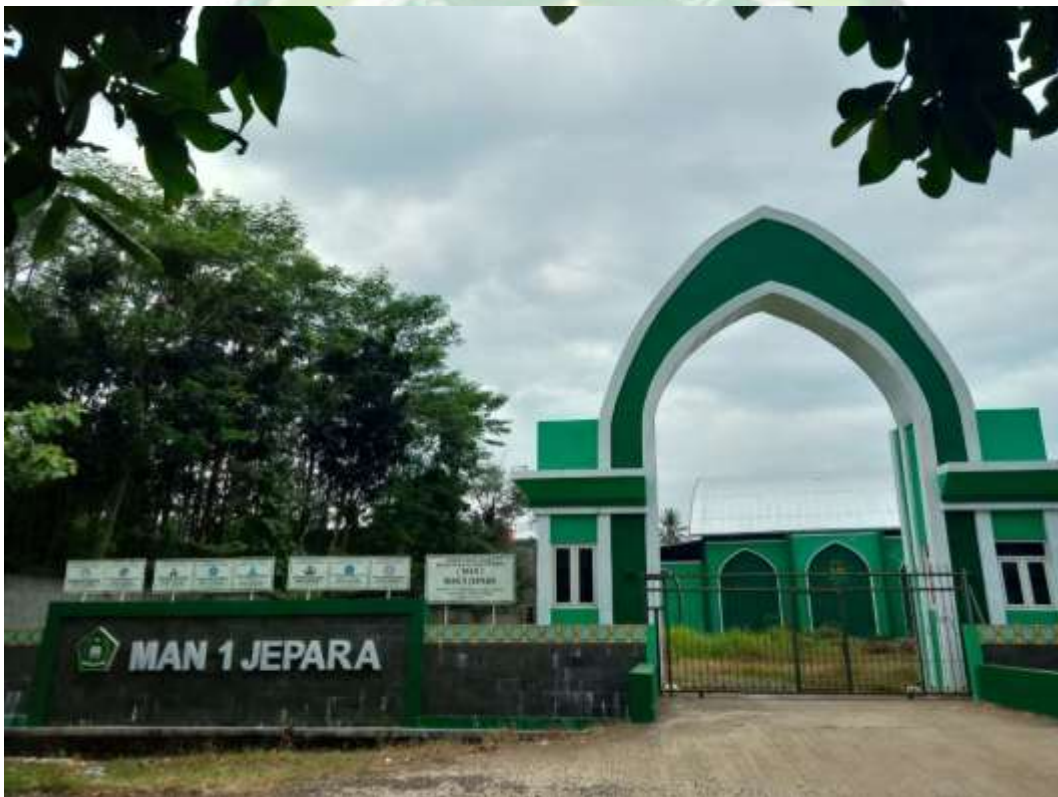
Tampak depan MAN 1 Jepara Sekarang