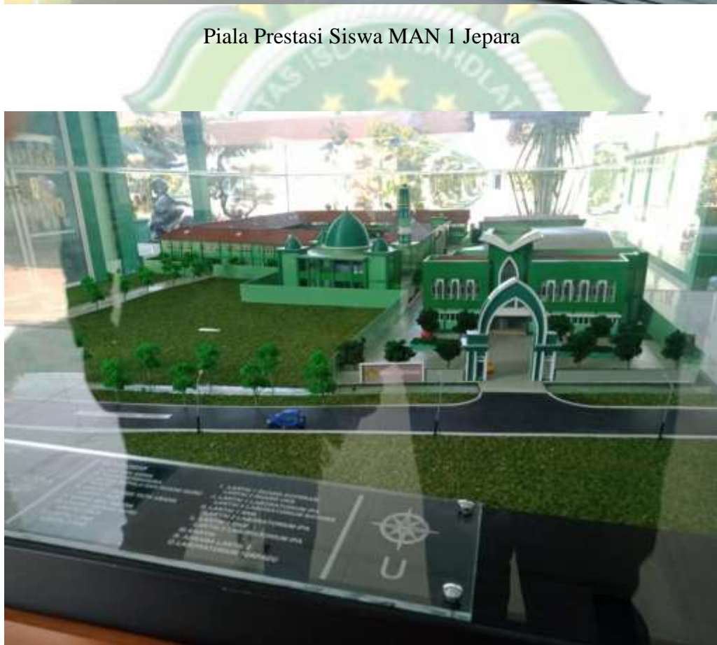
Miniatur Bangunan MAN 1 Jepra Sekarang