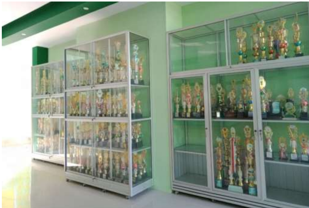
Piala Prestasi Siswa MAN 1 Jepra