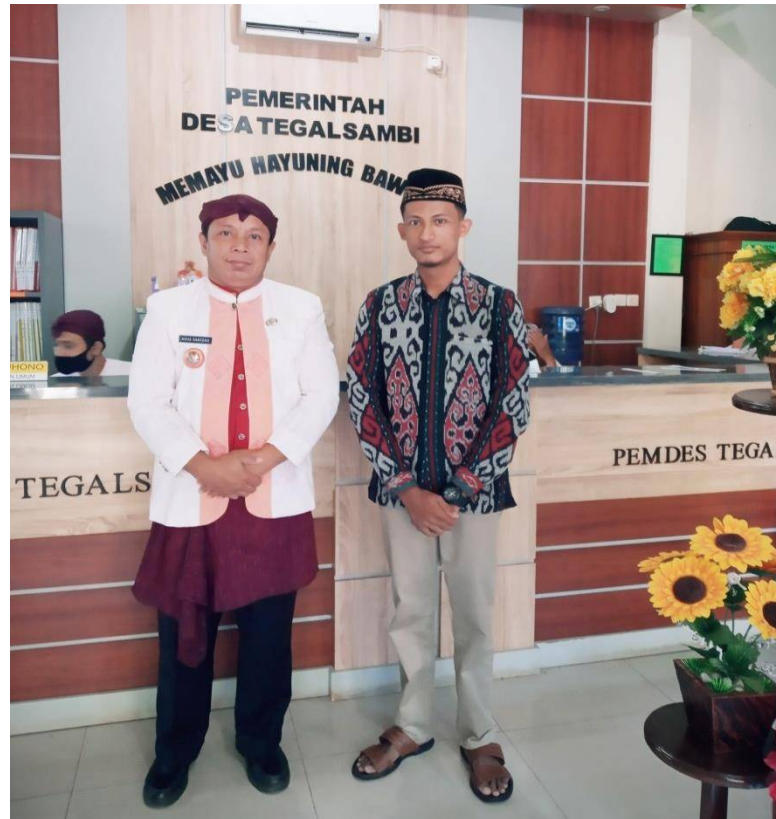
Gambar 2 wawancara dengan P3N desa Tegalsambi