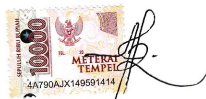
CHOIRONI ROFIQUL UMAM