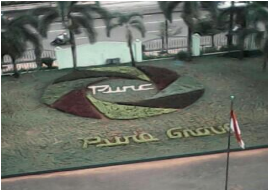
Lampiran 1. 6 Foto Kegiatan Penelitian