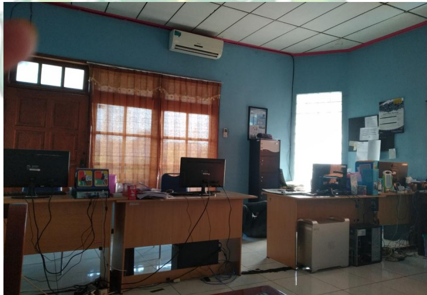
Ruang redaksi Jawa Pos Radar Kudus Biro Jepara