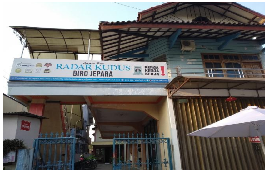
Halaman depan Kantor Redaksi Jawa Pos Radar Kudus Biro Jepara, Jl Pemuda No 90 Jepara.