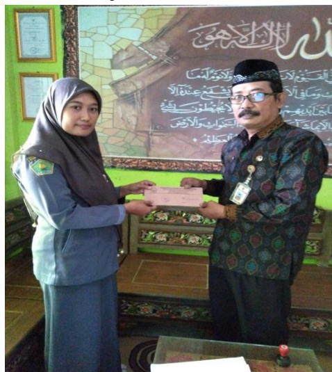
Penyerahan Surat Ijin Penelitian di MA NU Ittihad Bahari Bonang