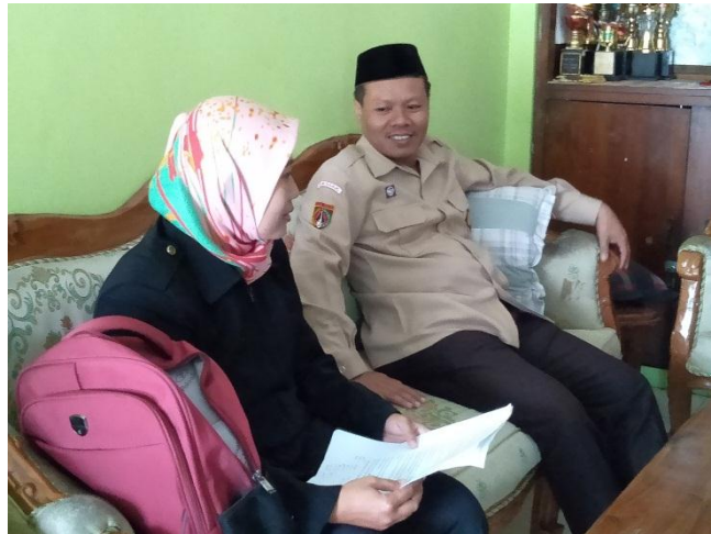
Wawancara dengan Waka Kurikulum MA NU Demak