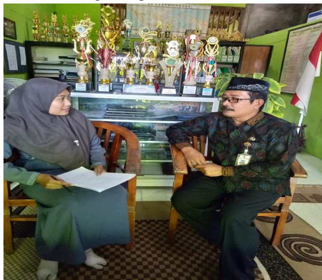
Wawancara Dengan Kepala Madrasah MA NU 03 Ittihad Bahari Bonang