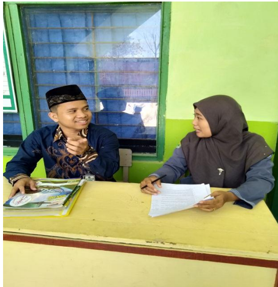
Wawancara dengan Guru MA NU Ittihad Bahari Bonang