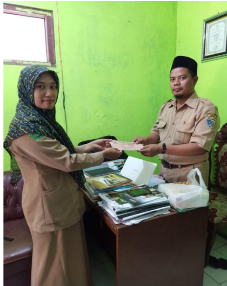
Penyerahan Surat Ijin Penelitian di MA Takhassus Al-Qur'an Bonang