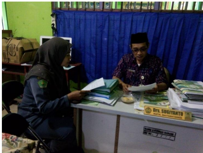
Wawancara dengan Waka Kurikulum MA NU Ittihad Bahari Bonang