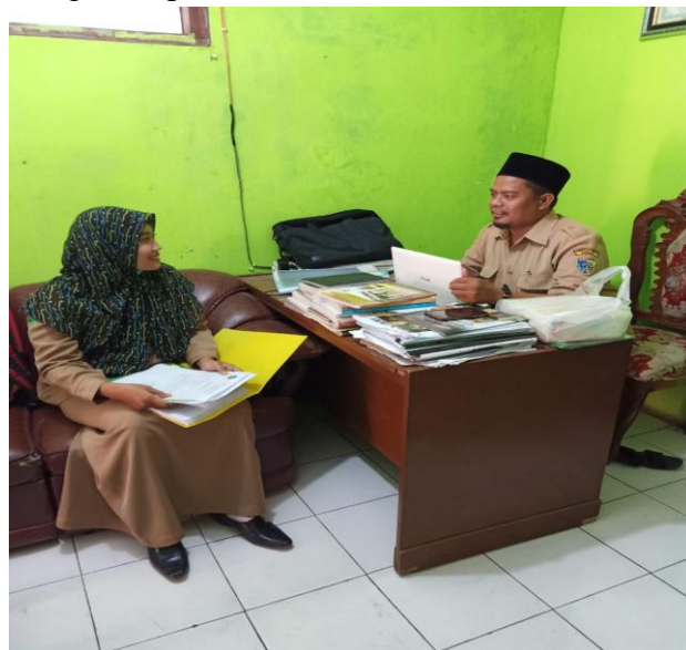
Wawancara Dengan Kepala Madrasah MA Takhassus Al-Qur'an Bonang