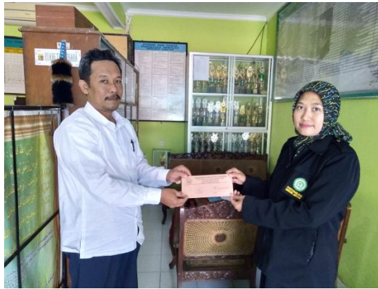
Penyerahan Surat Ijin Penelitian di MA NU Demak