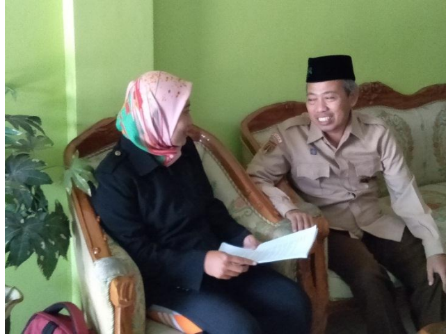
Wawancara dengan Guru MA NU Demak