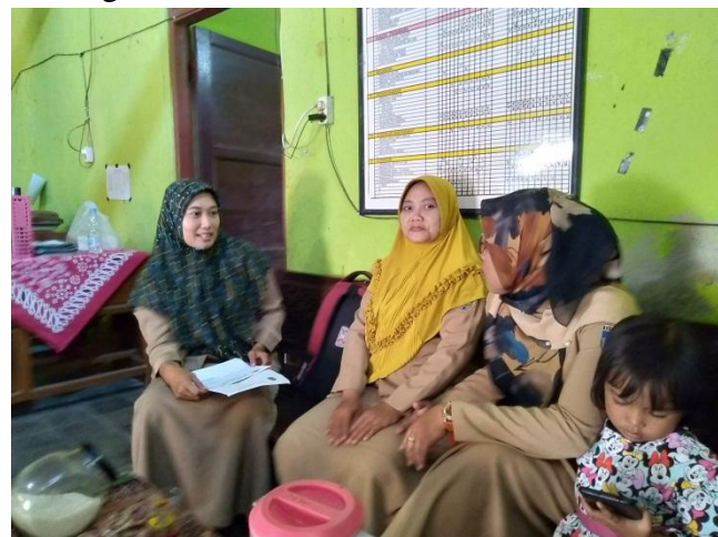
Wawancara dengan Waka Kurikulum MA Takhassus Al-Qur'an Bonang