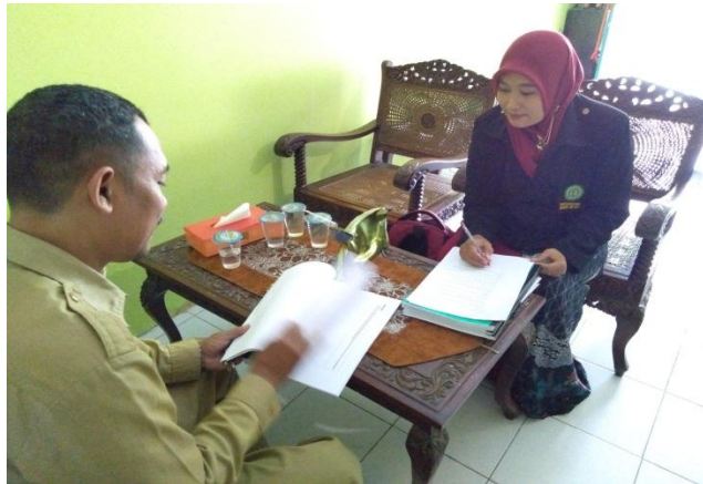
Wawancara Dengan Kepala Madrasah MA NU Demak