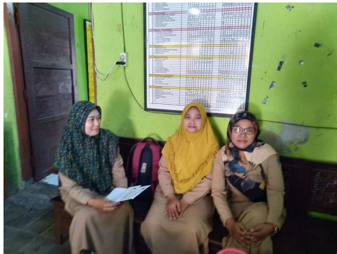
Wawancara dengan Guru MA Takhassus Al-Qur'an Bonang