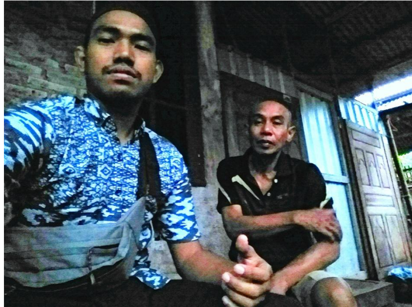
Wawancara dengan Kondi 53 Th., warga Desa Slagi pada tanggal 16 Februari 2020