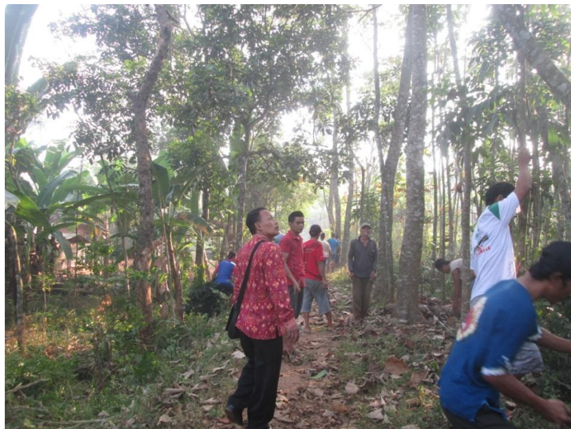
Kerja bakti perangkat desa bersama warga