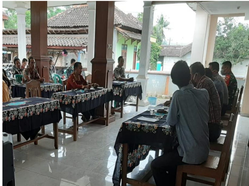
Rapat Musren Bangdes