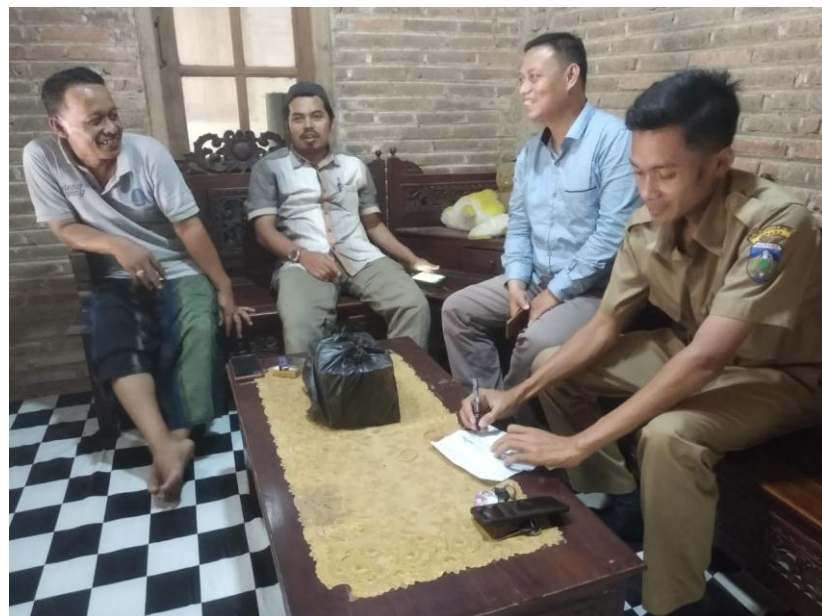
Kunjungan ke rumah warga