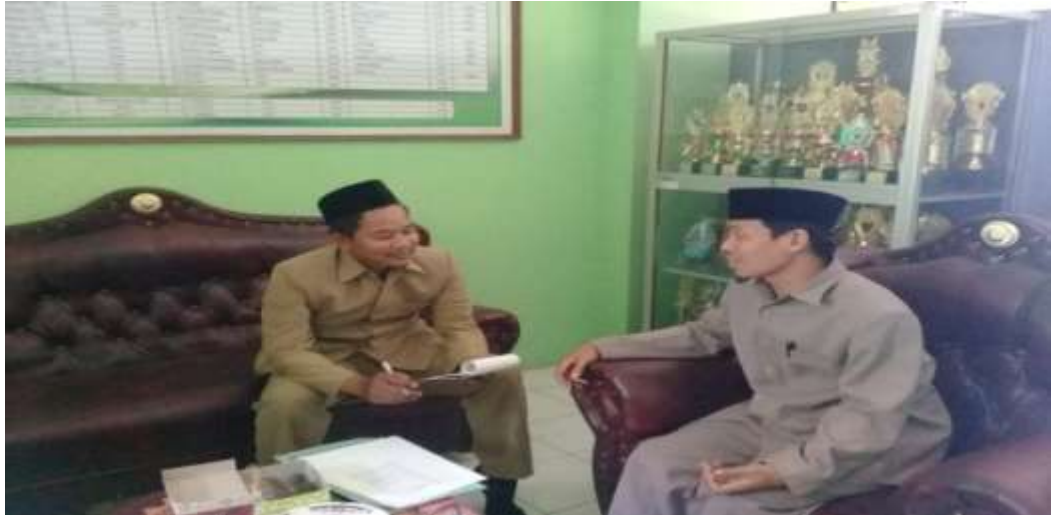
Wawancara dengan kepala madrasah