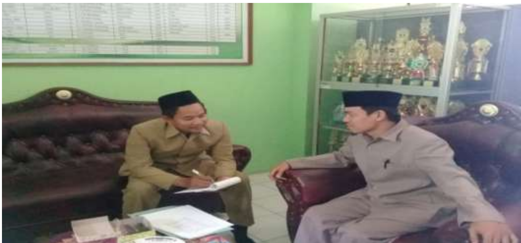
wawancara dengan kepala madrasah