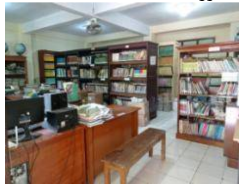
Gambar 4. Ruang Perpustakaan MTs Mathalibul Huda Mlonggo