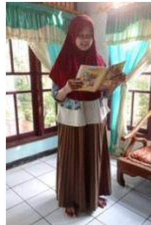
Gambar 10. Foto Peserta didik MTs Mathalibul Huda Mlonggo Bernyanyi Secara Individu Ketika Pembelajaran