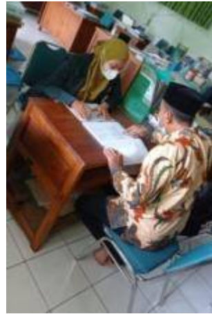
Gambar 8. Wawancara dengan Wakaur Kurikulum MTs Mathalibul Huda Mlonggo