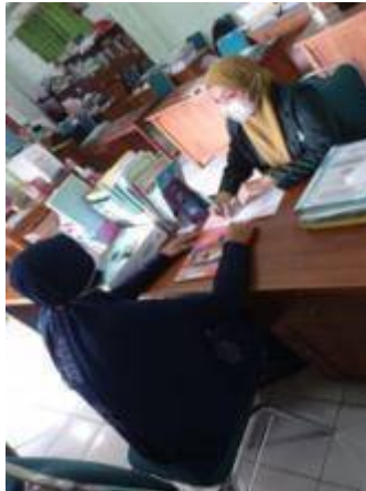
Gambar 7. Wawancara dengan Guru SKI MTs Mathalibul Huda Mlonggo