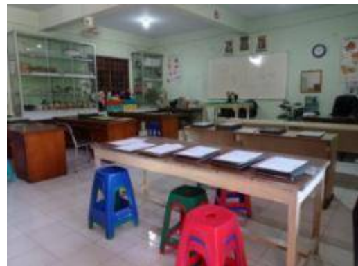
Gambar 6. Laboratorium IPA MTs Mathalibul Huda Mlonggo