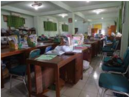
Gambar 3. Ruang Kantor Guru MTs Mathalibul Huda Mlonggo