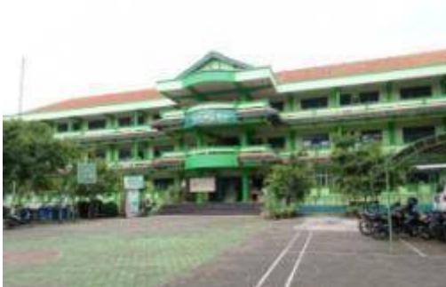
Gambar 1. Gedung MTs Mathalibul Huda Mlonggo