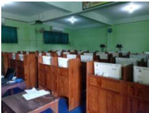
Gambar 5. Laboratorium Komputer MTs Mathalibul Huda Mlonggo