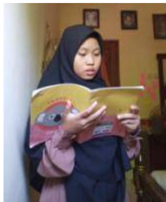
Gambar 9. Foto Peserta didik MTs Mathalibul Huda Mlonggo Bernyanyi Secara Individu Ketika Pembelajaran