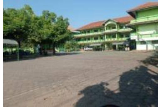
Gambar 2. Halaman Depan MTs Mathalibul Huda Mlonggo