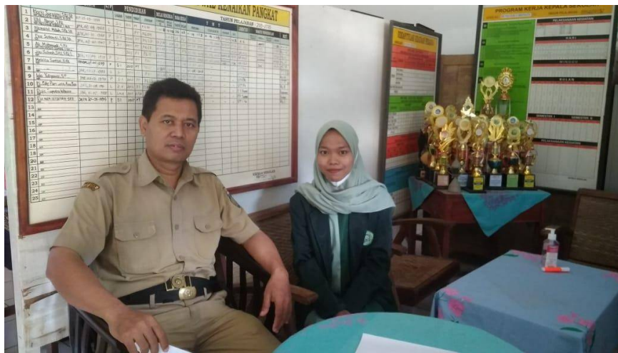
FOTO WAWANCARA PERTAMA UNTUK MENGETAHUI KINERJA GURU HONORER DI SD NEGERI BRINGIN 2