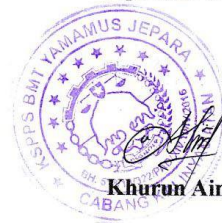
Khurun Ain, SE