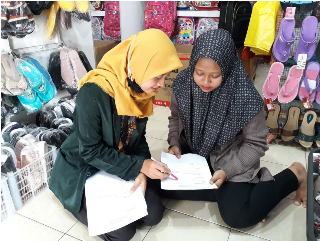
Penyebaran Kuesioner Kepada Anggota