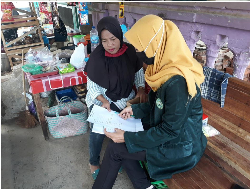
Penyebaran Kuesioner Kepada Anggota